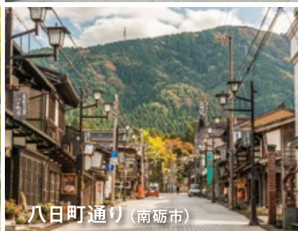
八日町通り (南砺市)