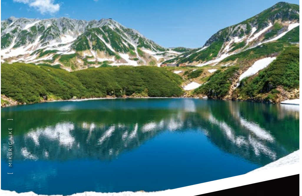
[ MIKURIGAIKE ]