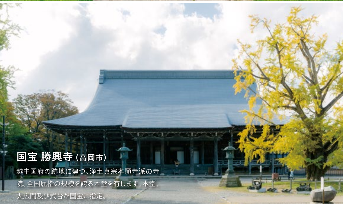
国宝 勝興寺 (高岡市)

真言密宗の大本山。3m超の不動明王像をはじめとする磨崖仏は国指定史跡・国指定重要文化財。