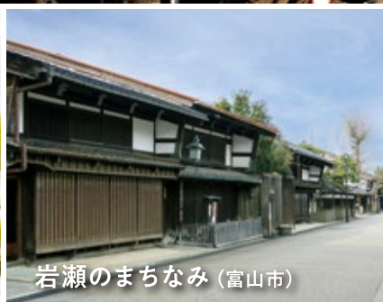
岩瀬のまちなみ (富山市)

越中国府の跡地に建つ、浄土真宗本願寺派の寺院。全国屈指の規模を誇る本堂を有します。本堂、大広間及び式台が国宝に指定。