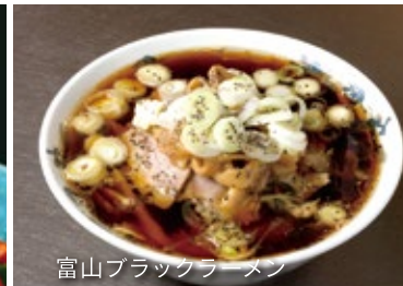
富山ブラックラーメン