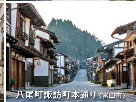
八尾町諏訪町本通り (富山市)

JAPANESE HERITAGE 日本遺産のまち 歴史や文化を感じる 富山のまちあるき