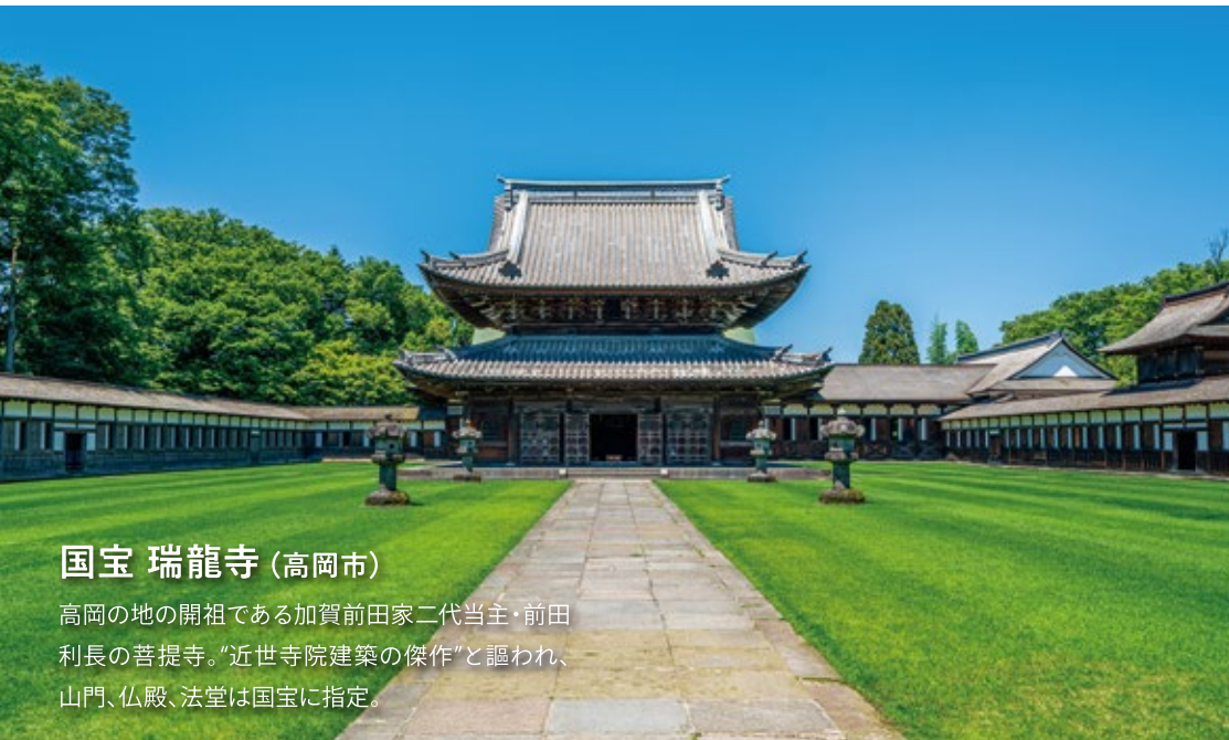
国宝 瑞龍寺 (高岡市)

高岡の地の開祖である加賀前田家二代当主・前田利長の菩提寺。“近世寺院建築の傑作”と謳われ、山門、仏殿、法堂は国宝に指定。