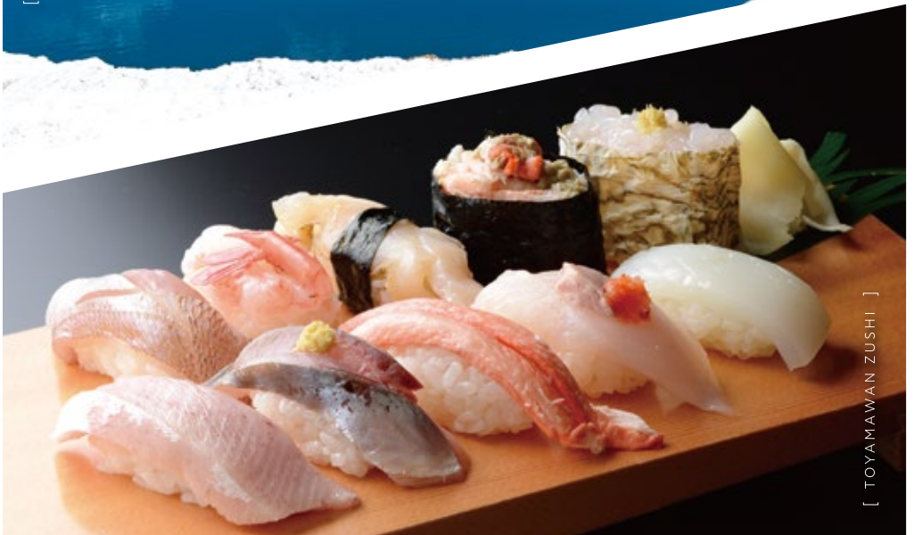
[ TOYAMAWAN ZUSHI ]