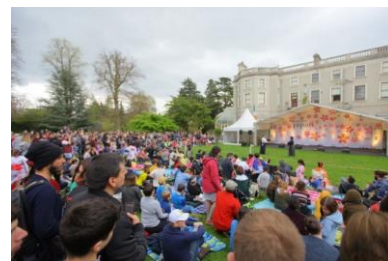
過去のイベント様子