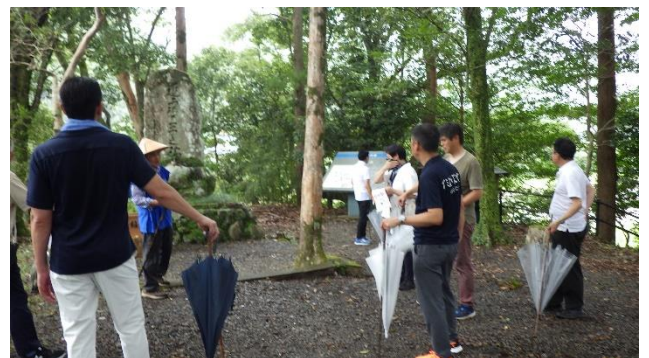
(左) tanabe en+にて説明、質疑応答