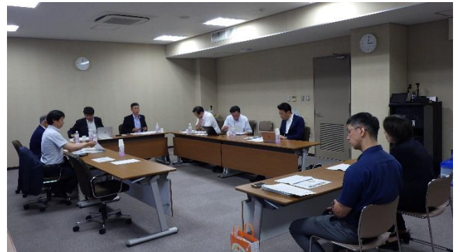
和歌山県議会（県庁北別館）にて説明、質疑応答