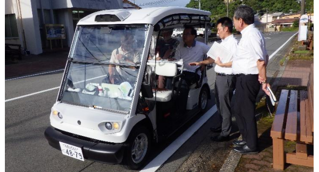
(左) 太地町公民館にて説明、質疑応答