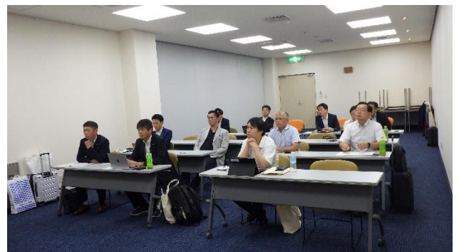
(左) (右) 南紀白浜空港にて説明、質疑応答