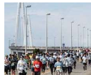
ランナーの様子(新湊大橋)