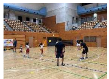
【やってみよう! 「タグラグビー」教室】