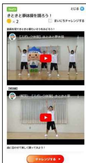
動画を活用したミッション画面

ウ R7実績 ・利用者数 小学生：36,851人 中学生：19,619人 ・キャンペーン応募数（2回実施）11,624口 ・Youtubeチャンネル登録者数2,430人 視聴回数32万回（R7）