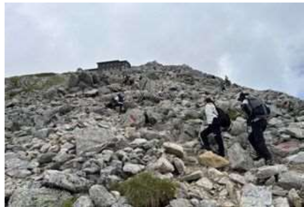
集団登山引率者講習会の様子 (R7)