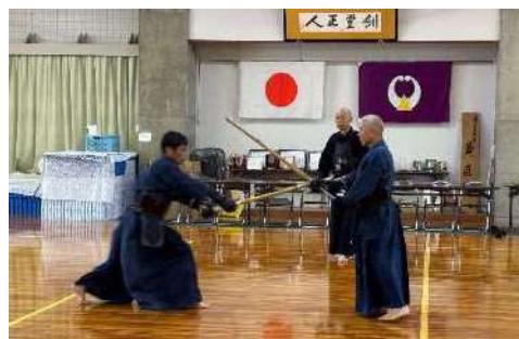
武道資格認定講習会(剣道)