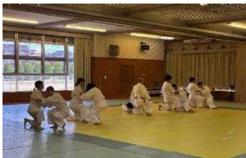
武道資格認定講習会(柔道)