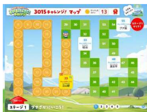
チャレンジマップ画面