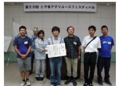
とやまアグリユースフェスティバルでの意見発表