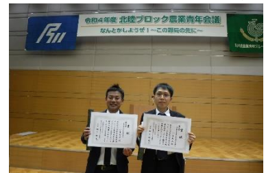
北陸ブロック農業生産会議での発表