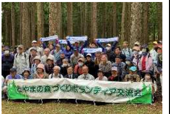
森林ボランティア交流会(R5.5.28)