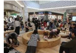
とやま木育フェア(R5.10.28~29)