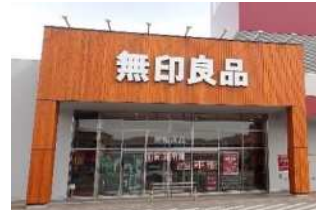
民間建築物の木質化