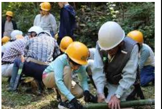
県民が企画・実践する森づくり