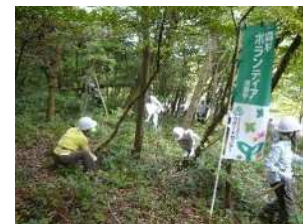
県民による里山林整備