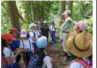
森の寺子屋の開催