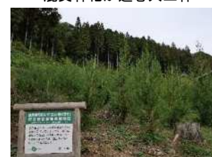
「立山 森の輝き」の植栽