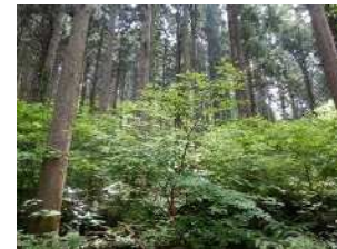
混交林化が進む人工林