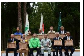
水と緑の森づくり表彰(R5.5.28)