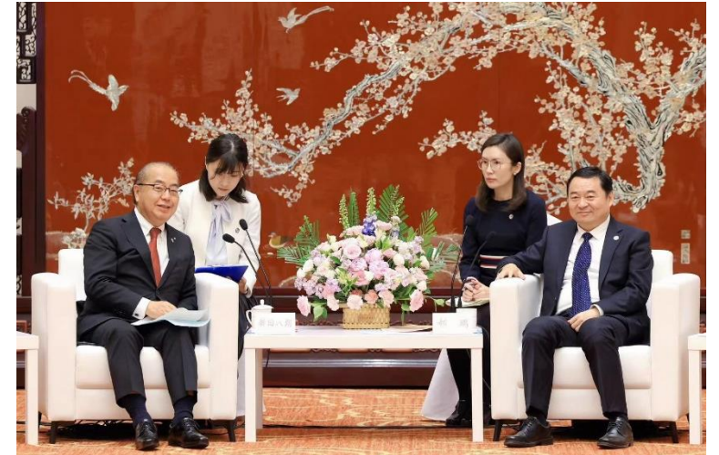
対談する新田知事と郝鵬書記