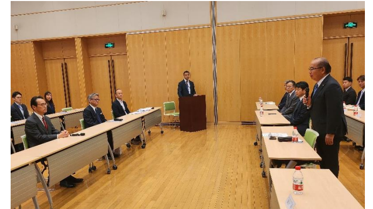
在中国日本大使館