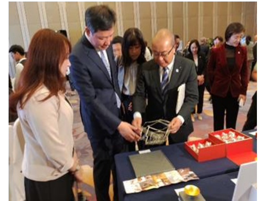
とやま県産品フェアin遼寧