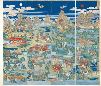
『立山曼荼羅』吉祥坊本 慶應2年(1866) (国指定重要有形民俗文化財) 富山県立山博物館蔵