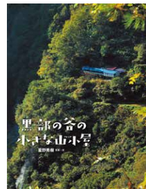
『黒部の谷の小さな山小屋』2023年 写真・文 星野秀樹 出版社 アリス館

『黒部の谷のトロッコ電車』の絵本原画と写真絵本『黒部の谷の小さな山小屋』の写真パネル及び当館所蔵の山岳文学資料を展示します。写真家・高橋敬市さんが撮影した立山・黒部の写真もスライド投影でお楽しみください。