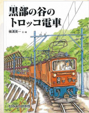
『黒部の谷のトロッコ電車』2015年 文・絵 横溝英一 出版社 福音館書店