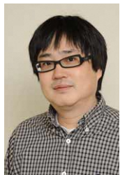
六角精児氏 (俳優・ミュージシャン)