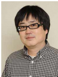
六角精児氏 (俳優・ミュージシャン)