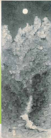
下保昭『黒部月宵』1999年 富山県水墨美術館蔵