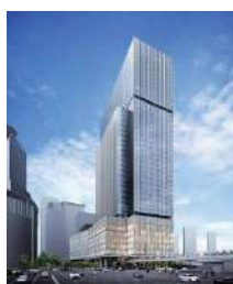
建物外観イメージ