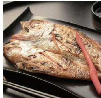
のどぐろの開き (石川)