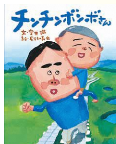
『チンチンボンボさん』 室井滋・作/絵本館/2015年