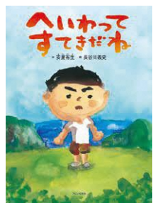
『へいわってすてきだね』 安里有生・詩/ ブロンズ新社/2014年