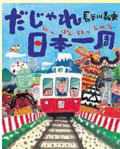
『だじゃれ日本一周』 理論社/2009年