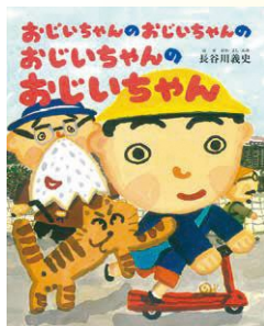
『おじいちゃんのおじいちゃん』 おじいちゃんのおじいちゃん』 BL出版/2000年