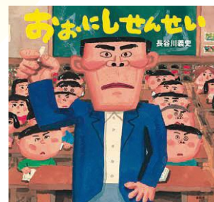
『おおにしせんせい』 講談社/2019年