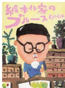
『絵本作家のブルース』 読書サポート/2019年