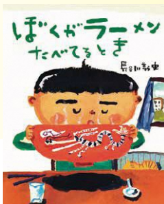
『ぼくがラーメンたべてるとき』 教育画劇/2007年