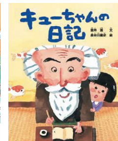
『キューちゃんの日記』 室井滋・作/北日本新聞社/2023年