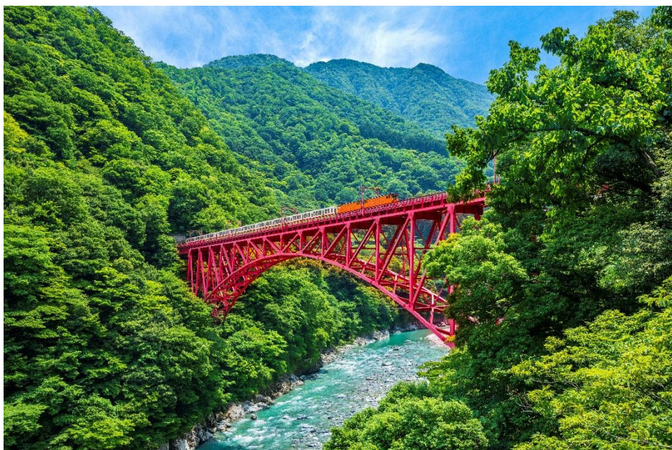
黒部峡谷トロッコ電車

また、黒部宇奈月キャニオンルートを開始延期を受け、同ルートの体験を臨場感をもって味わえる映像コンテンツを宇奈月温泉周辺で提供し、機運を醸成