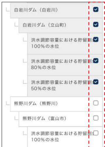
ダム貯水位の基準値選択例