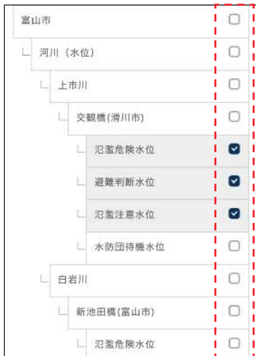
河川水位の基準値選択例