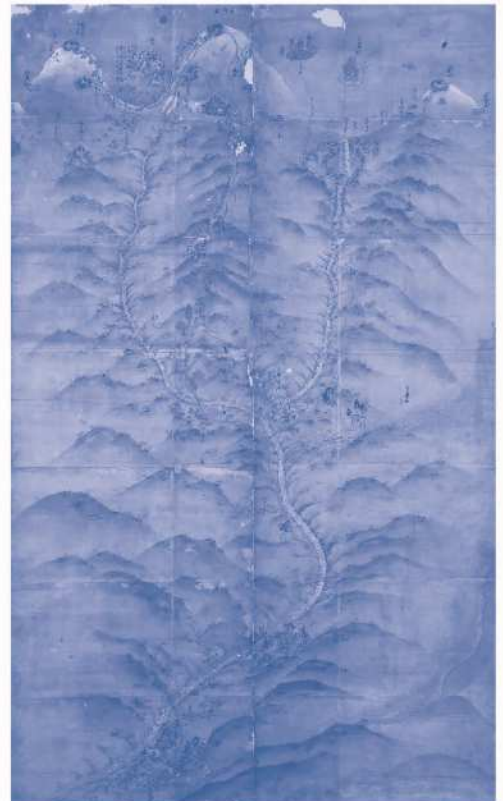
林西寺本白山曼荼羅(林西寺蔵、白山市指定有形文化財)