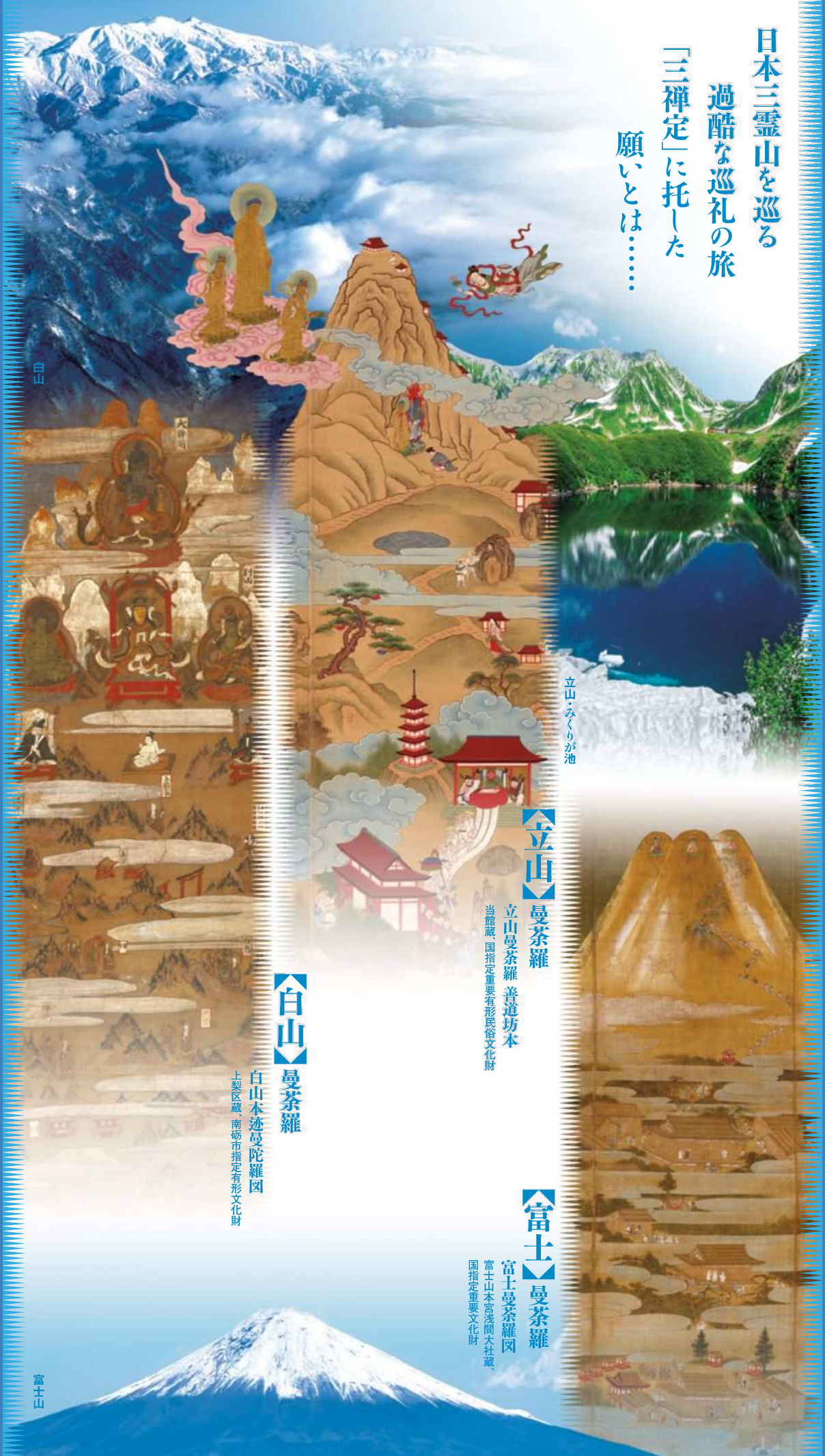
立山・みくりが池