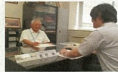
海外販路開拓サポートデスクでの面談