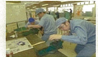
とやまの名匠の実技指導