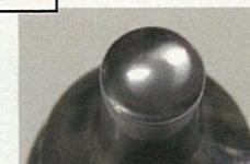
製剤成型金型 (株北熱)

「ガラス繊維を活用したLPG用FRPポンベの開発」ほか (北陸エステアール協同組合)