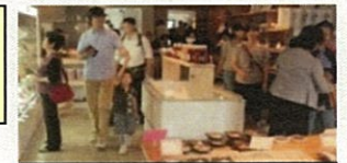
惣菜店・カフェ「藤吉」

住民ニーズに基づき惣菜店・カフェ「藤吉」開業(魚津市) 商店街活性化計画策定準備(魚津市) 市町村を跨いだ「まちコン」実施(南砺市・氷見市)