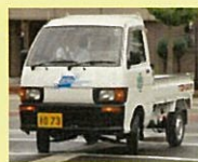
水素自動車 (トナミ運輸(株))