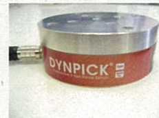
6軸力覚センサ (株式会社ワコーテック)