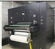
(エレクトロスピニング装置)