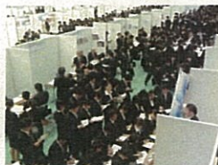
Uターンフェア イン とやま(H24)