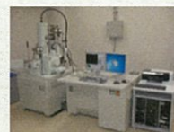
電界放出型 走査電子顕微鏡