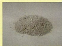
土壌改良固化剤 (株ETSジャパン)