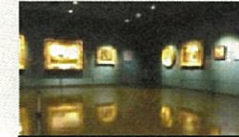
ギャラリー・ミレー

「ギャラリー・ミレー」整備、 「クリスマスペットボトルアート in TAKAOKA」開催 等