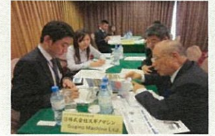
ものづくりセミナーin台北