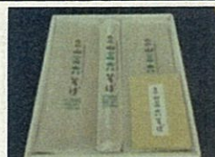
さんろく立山三六そば (立山町)

立山町のそばや氷見市の梅、南砺市の干柿など、地域の資源を活用した 新商品の開発6件を採択