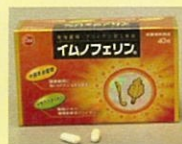
加工食品 (第一薬品工業(株))