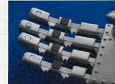
ゴム製触覚センサ (株式会社オーギャ)