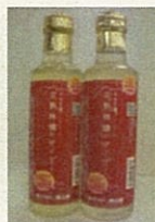
完熟林檎のサイダー

完熟林檎のサイダー(H22~H24): 発売後まもなく増産を決定 (H23当初6千本→増産後1万8千本、H24 2万4千本)