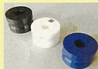
打錠臼 (株ピー・エム・プロダクツ)

・ファインセラミックス製打錠臼 ・加工食品「イムノフェリン」 ・小型破砕機「クロスシュレッダー」など