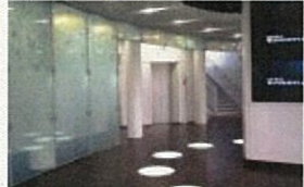
サン・ファイン、ノンスリップガラス (意匠ガラス、四季防災館で採用)