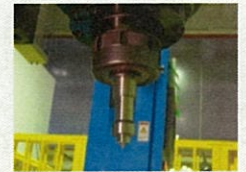
摩擦攪拌接合(FSW)用工具 (株式会社北熱)