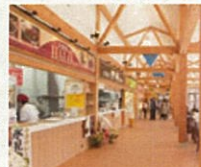
ひみ番屋街 フードコート