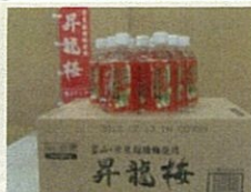
昇龍梅ドリンク (氷見市)