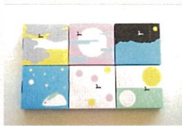
(月世界・まいどはや)