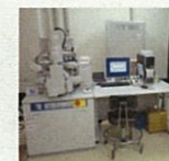
集束イオンビーム 加工機