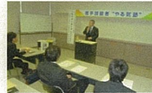
企業経営者の講話