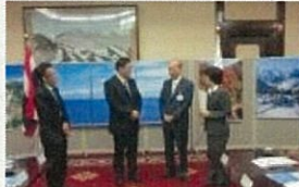
タベストリー・ディスプレイ