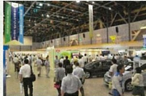
テクノフェア会場風景

商談成約額 H22:約55億円 H24:約50億円 商談件数 H22:1,025件 H24:1,541件(前回は50%増加)