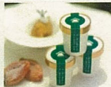
ラム酒に漬けた干柿のアイス (南砺市)