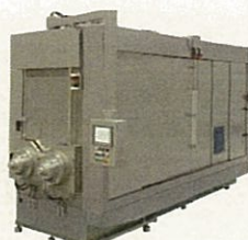
太陽電池向けマルチウエ ハースライサ「PV800H」 (コマツNTC株式会社)