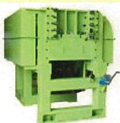
エコセパレ®分離・破碎機