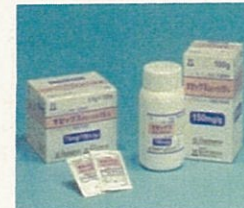
オゼックス細粒小児用15% (富山化学工業株式会社)