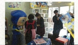
氷見市商店街での臨店研修

8商店街32店舗が参加 オリジナル商品のディスプレイ方法変更により 売上増(南砺市) 既存店舗内にキャラクター等を活用したギャラリー & ショップのコーナーを設置(氷見市)