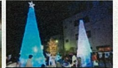
クリスマスペットボトルアート in TAKAOKA