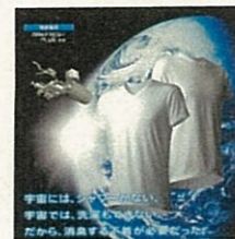
汗・加齢臭 消臭下着 MXP (株式会社ゴールドウィン)