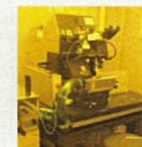
ナノインプリンティング 装置

・断熱、抗菌等の機能性繊維、衣服の開発(株エヌエス・ブレーン) ・生物由来樹脂の超微細プレス加工技術の開発(株リッチェル) など、計7件の研究開発を実施