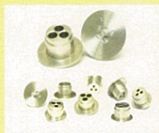
節水システムエコ

市場調査や国内外の見本市出展等を支援 【補助率】1/3 国内:25万円 海外:50万円