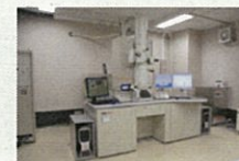
透過型電子顕微鏡