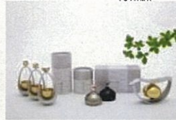
おりん 優凛シリーズ