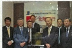
バンコクビジネスサポートデスク開所式(H24.12)