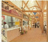
ひみ番屋街フードコート