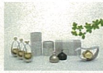
おりん 優凜シリーズ