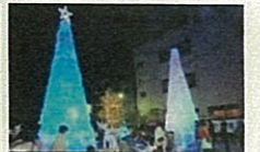
クリスマスペットボトルアート in TAKAOKA