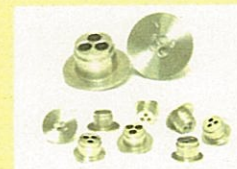
節水システムエコ