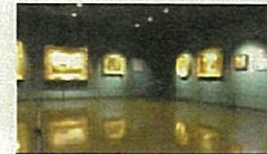
ギャラリー・ミレー