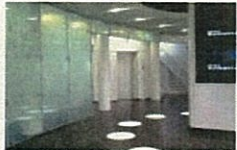
サン・ファイン、ノンスリップガラス (意匠ガラス、四季防災館で採用)