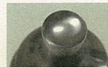
製剤成型金型 (株北熱)