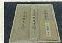
さんろく 立山三六そば(立山町)

立山町のそばや氷見市の梅、南砺市の干柿など、地域の資源を活用した 新商品の開発6件を支援