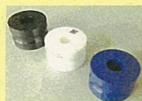
打錠臼 (株ビー・エム・プロダクツ)