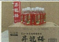
昇龍梅ドリンク (氷見市)