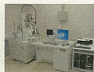
電界放出型 走査電子顕微鏡