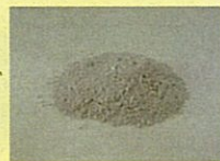
土壌改良固化剤 (株ETSジャパン)