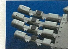
ゴム製触覚センサ (株式会社オーギャ)