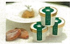
ラム酒に漬けた干柿のアイス (南砺市)