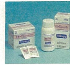
オゼックス細粒小児用15% (富山化学工業株式会社)