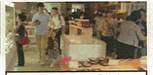
惣菜店・カフェ「藤吉」