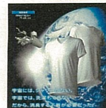
汗・加齢臭 消臭下着 MXP (株式会社ゴールドウイン)