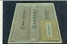
さんろく 立山三六そば(立山町)

立山町のそばや氷見市の梅、南砺市の干柿など、地域の資源を活用した新商品の開発6件を採択