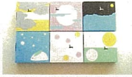
(月世界・まいどはや)