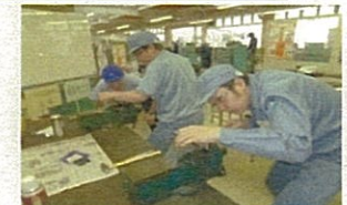
とやまの名匠の実技指導