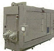
太陽電池向けマルチウエ ハースライサ「PV800H」 (コマツNTC株式会社)