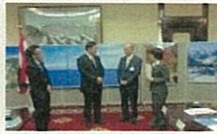
タバストリー・ディスプレイ