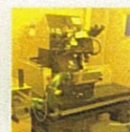
ナノインプリンティング 装置