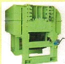
エコセバレ®分離・破砕機