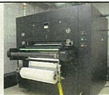
(エレクトロスピニング装置)