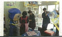
氷見市商店街での臨店研修