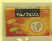
加工食品 (第一薬品工業株)