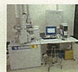
集束イオンビーム 加工機