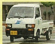
水素自動車 (トナミ運輸株)