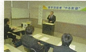
企業経営者の講話