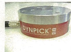
6軸力覚センサ (株式会社ワコーテック)