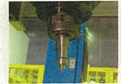
摩擦撹拌接合(FSW)用工具 (株式会社北熱)