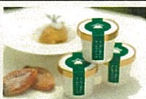
ラム酒に漬けた干柿のアイス (南砺市)