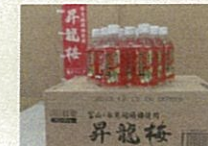
昇龍梅ドリンク (氷見市)