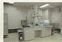
透過型電子顕微鏡