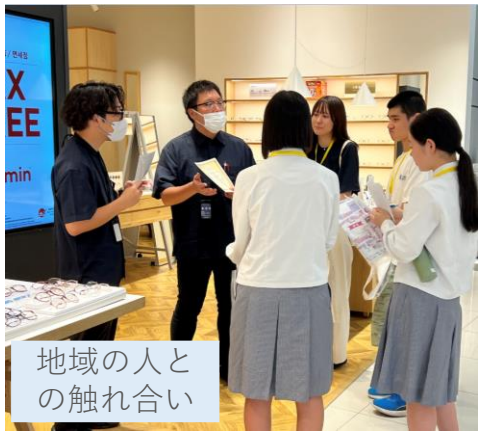
地域の人との の触れ合い