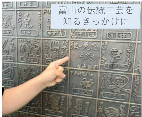
富山の伝統工芸を 知るきっかけに