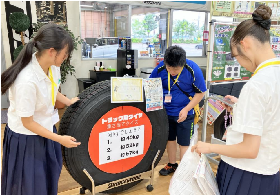
仲間とのつながり、協力