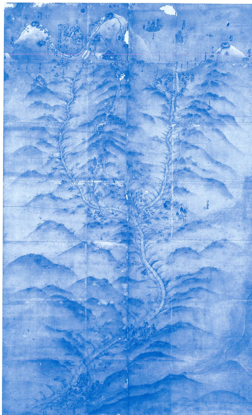
林西寺本白山曼荼羅（林西寺蔵、白山市指定有形文化財）