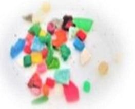
マイクロプラスチック