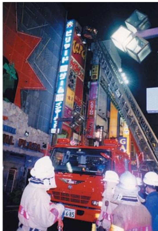
（出典）東京消防庁 写真の掲載については著作権者の許諾を得ています。