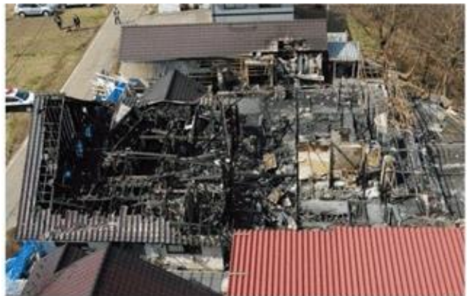
(出典) 総務省消防庁 平成21年版 消防白書 写真の掲載については著作権者の許諾を得ています。