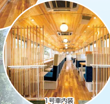
上記写真は全てイメージ / 写真提供:あいの風とやま鉄道