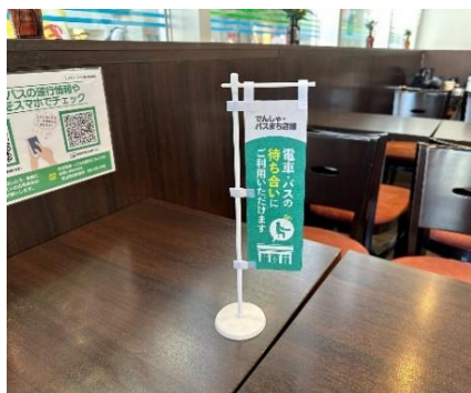
店舗入口ステッカーとのぼり