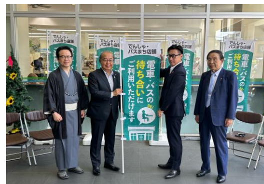
「でんしゃ・バスまち店舗」開設式(7月22日)