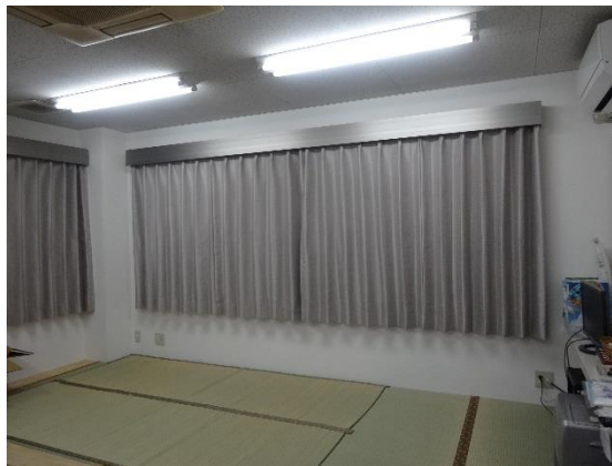
県の支援制度を活用した女性休憩所の新設（加越能バスの例）