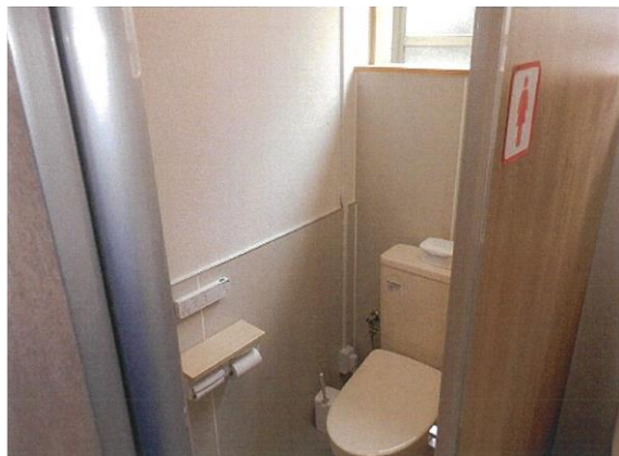
県の支援制度を活用した女性トイレの新設（富山地方鉄道の例）