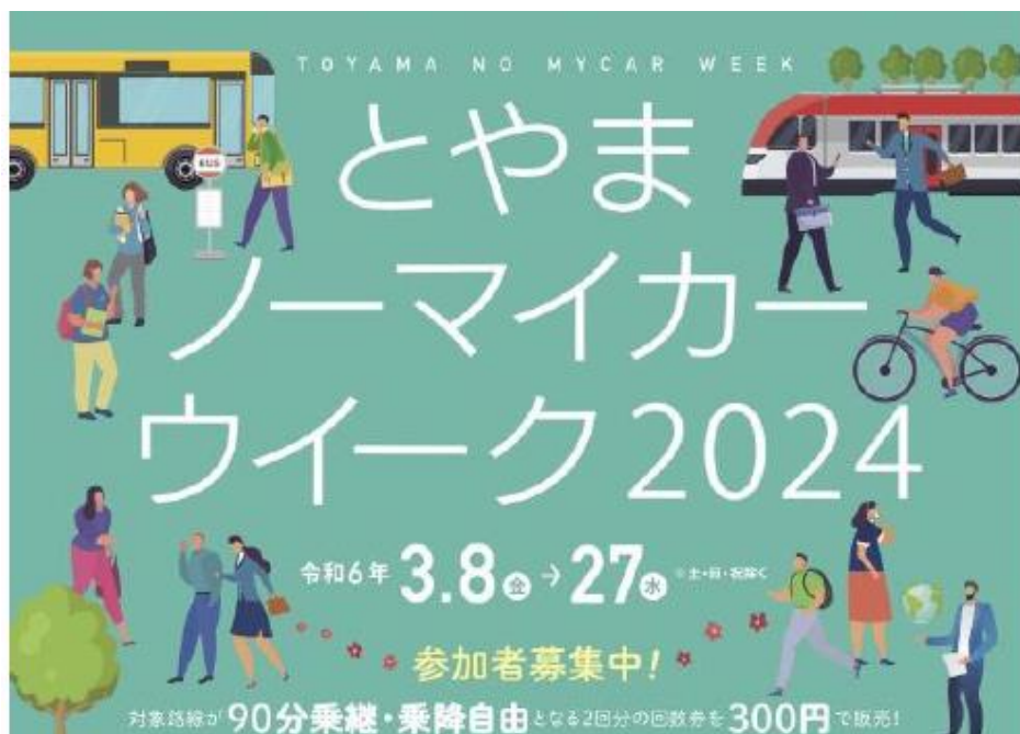
昨年度実施した「県・市町村統一ノーマイカーウィーク運動」の例