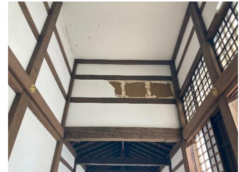
被災した瑞龍寺(大庫裏)