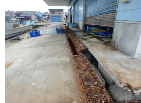
水産業共同利用施設