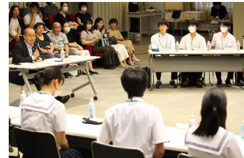
知事とのこども意見表明交流会