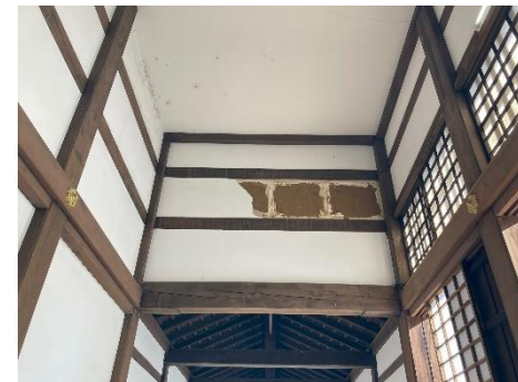
被災した瑞龍寺(大庫裏)