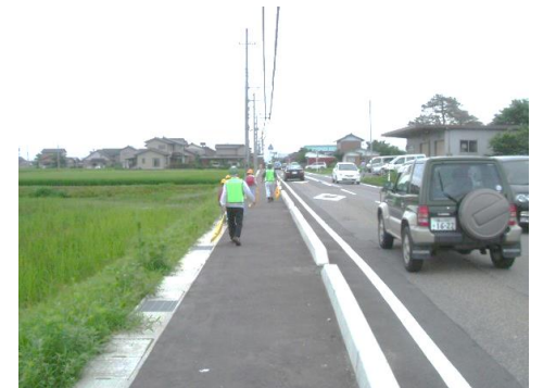
道路交通の安全対策（歩道整備）