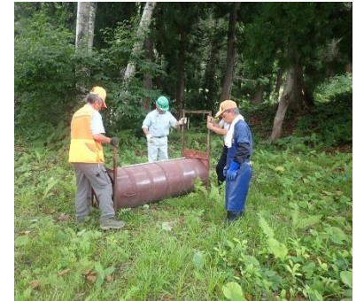
クマ対策の罠設置

自然災害対策や道路交通の安全確保対策など安全・安心な県土づくり、地域の生活基盤の整備等