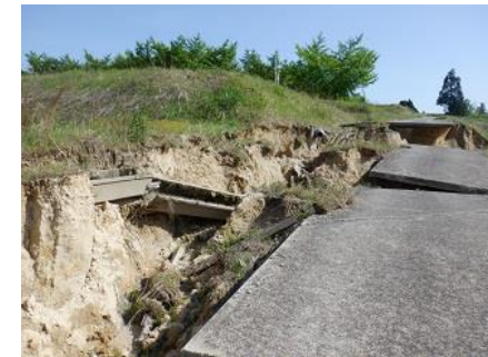
被災した農道（南砺市）