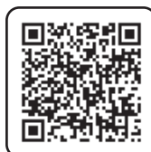
専用申込フォーム