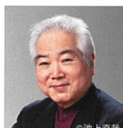
池田菊衛 (ヴァイオリン)