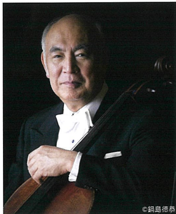
堤 剛 (チェロ) とやま室内楽フェスティバル音楽顧問 サントリーホール館長