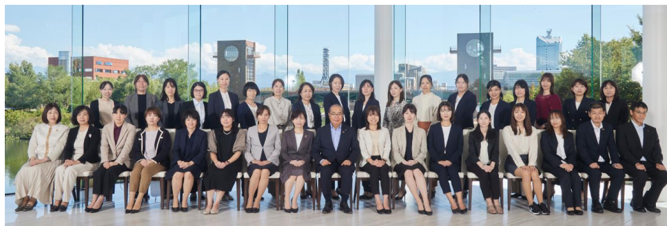
煌めく女性ネットワークブラッシュアップ事業