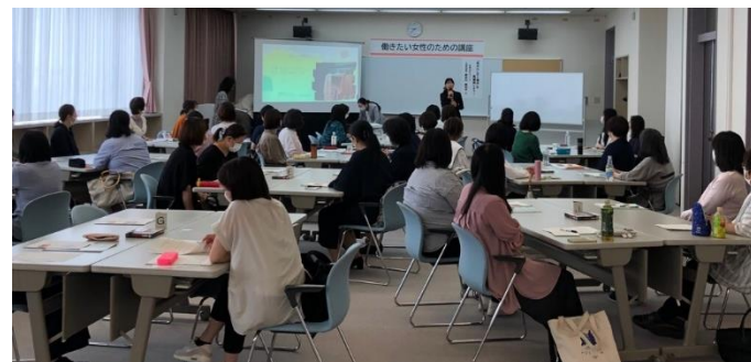
女性のキャリアデザイン応援事業