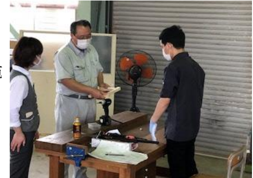
技能実習生講習(金属プレス)