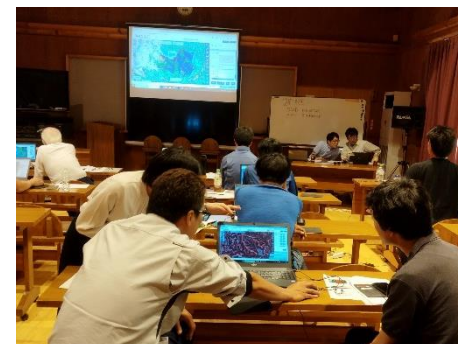
森林クラウド操作研修