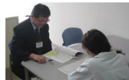
キャリアコンサルティング