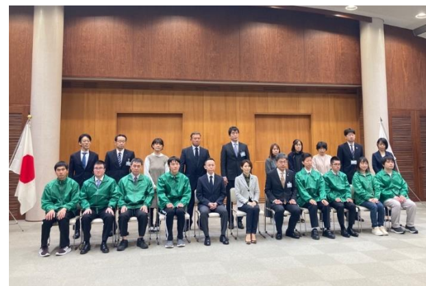
アビリンピック選手団激励会