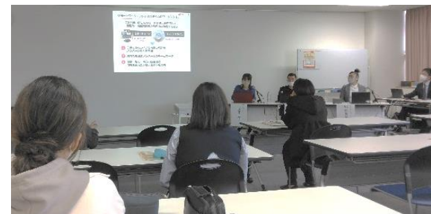
女性の多様な働き方支援事業