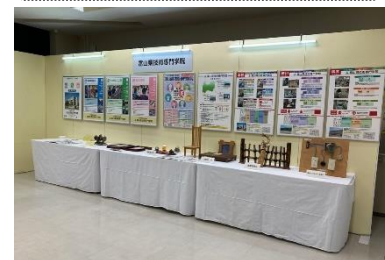
ポリテックビジョンへの出展