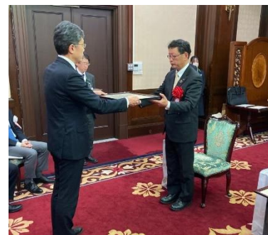
職業能力開発優良企業表彰