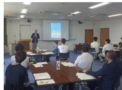
とやま中小企業人材育成カレッジ