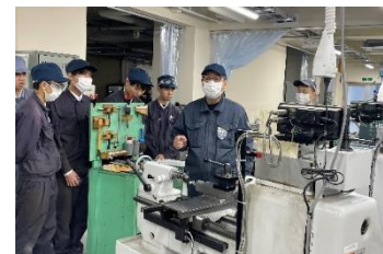
高校生に対する技能出前講座