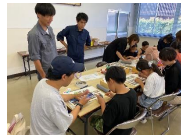
夏休みものづくり体験