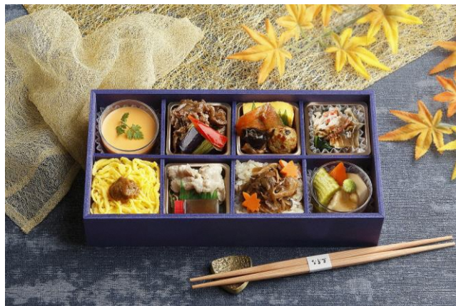
なだ万厨房『北陸4県フェア味めぐり』 (イメージ)

なだ万オリジナル「都道府県別産直フェア」は、国内外のお客様に日本料理文化のさらなる魅力を発信することを目的としたイベントとして2018年から開催しており、地域活性化にもつながる取り組みとしてシリーズ展開しています。総料理長を中心に現地を巡り、なだ万の調理人が吟味した各地の食材や特産品を使用した特別メニューをご用意します。