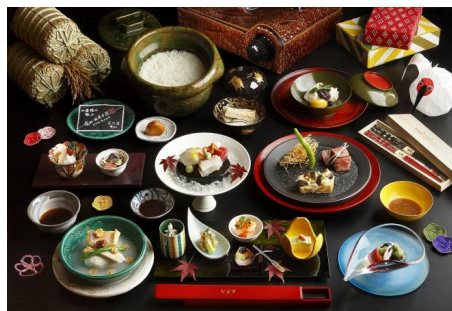
16,000円(17,600円税込)コース(イメージ)