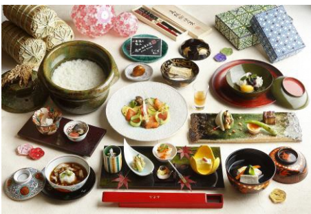
10,000円(11,000円税込)コース(イメージ)