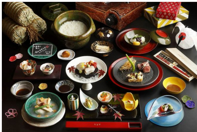
レストラン『北陸4県フェア特別コース』 16,000円(17,600円税込)コース (イメージ)

株式会社なだ万（本社：東京都渋谷区、社長：小野寺 裕司）は、なだ万オリジナル「都道府県別産直フェア」の10回目として『北陸4県フェア』を10月1日から11月30日まで開催します。10月1日から10月31日には全国のなだ万厨房ショップ41店舗となだ万の通販サイトで特別弁当を、10月23日から全国のレストラン19店舗にて特別コースを販売します。