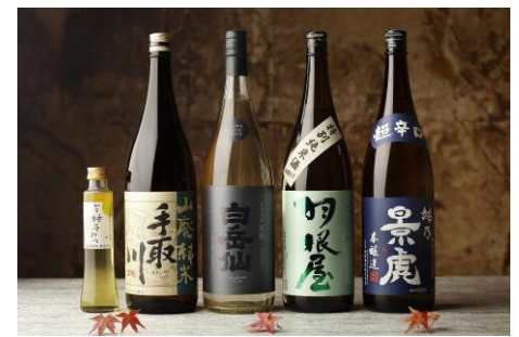
フェアドリンク(イメージ)