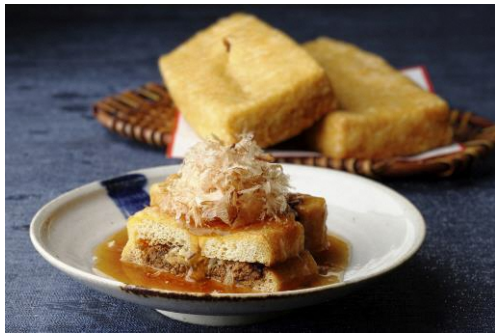
栃尾あげ鶏味噌焼生姜あん (盛付イメージ)