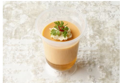
食べるスープ 雪下人参 (イメージ画像)