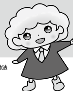
パートタイム・有期雇用労働法 キャラクター 「パχύうちゃん」