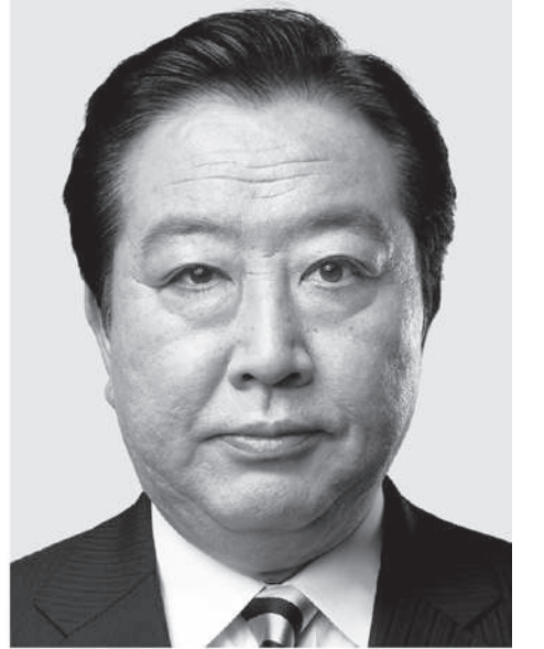
立憲民主党 代表 野田佳彦