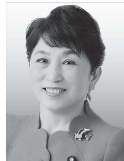
社民党党首 福島みずほ