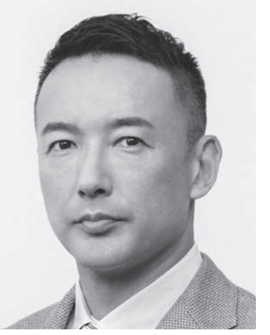
れいわ新選組 代表 山本太郎