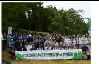
森林ボランティア交流会(R6.5)