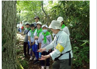
森の寺子屋の開催(R6.8)