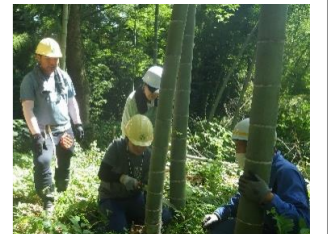
県民が企画・実践する森づくり熊無地区嶽の宮竹林整備協議会(R6.8)