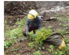
「立山 森の輝き」の植栽(R6.5)