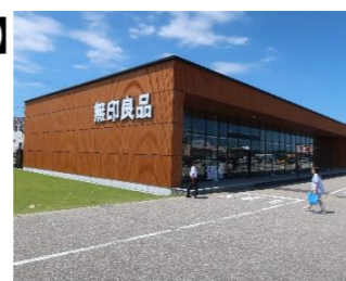
民間建築物の木質化(R6.4)