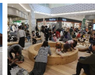
とやま木育フェア(R5.10)