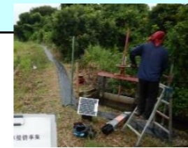
クマ防止電気柵の設置(R6.8)