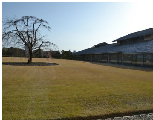
【喫茶から庭園の眺め】