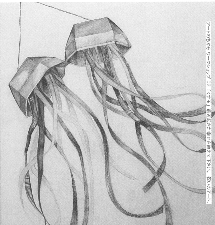
アートの中からワークショップ 02 「す玉」 最近起きた幸せを教えてください。祝いのアート。