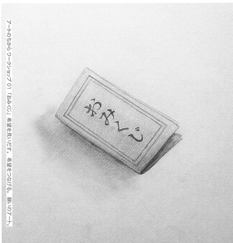
アートの中からワークショップ 01 「おみくじ」 希望を見いだす。希望をつなげる。願いのアート。