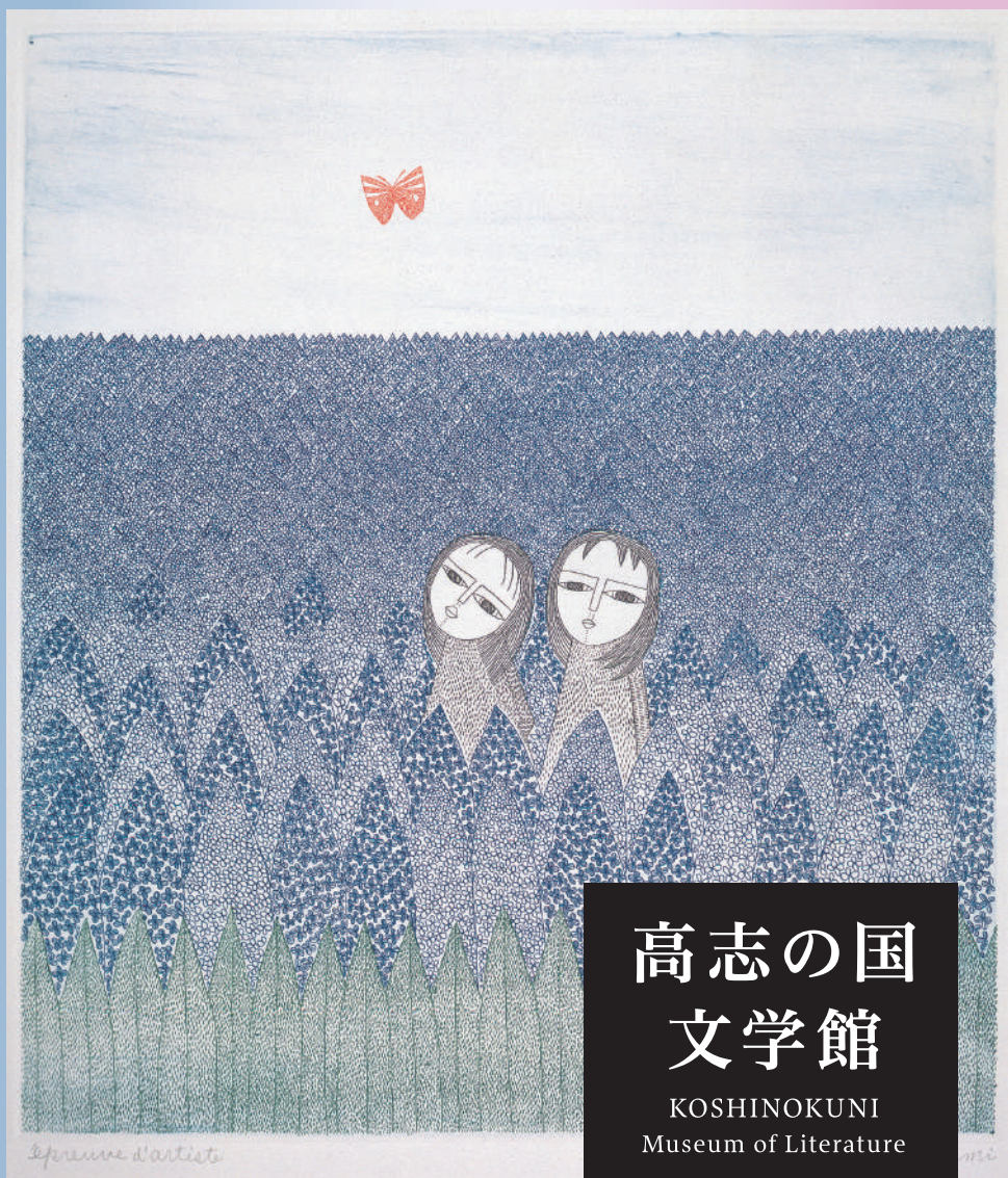
《2人の少女と蝶》1979年 エッチング、サンドペーパー 32.0×28.3cm ミュゼ浜口陽三・ヤマサコレクション蔵