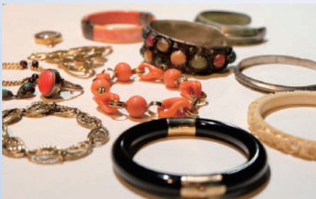
生前に蒐集したアクセサリー (ミュゼ浜口陽三・ヤマサコレクション蔵)

南桂子(1911-2004)は、現在の富山県高岡市に生まれ、県立高岡高等女学校では絵画制作や詩作に親しむ多感な少女時代を過ごしました。戦後まもなく上京し、銅版画と出会った南は、パリやサンフランシスコなど海外で活躍し、森の中の城、塔、少女や小鳥などをモチーフに、繊細で詩情あふれる銅版画作品を残しました。