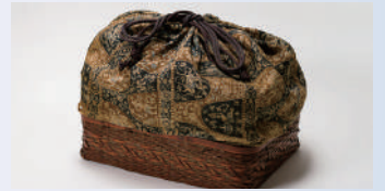
手書きの原稿が詰められていた巾着箱 (ミュゼ浜口陽三・ヤマサコレクション蔵)

没後20年を機に開催する本展では、銅版画作品と自作の童話や詩、詩人たちのことばをとおして、南桂子の世界を旅します。