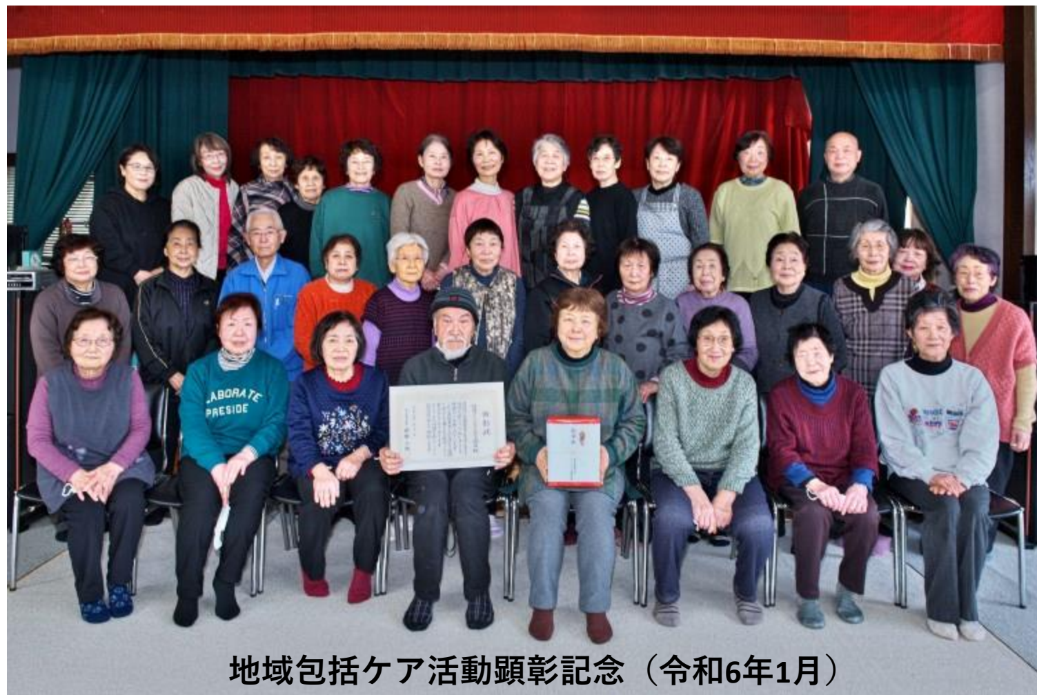
地域包括ケア活動顕彰記念（令和6年1月）