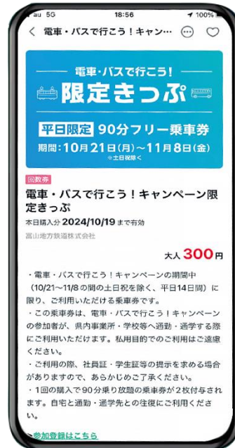
デジタル乗車券イメージ