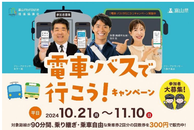
キャンペーンPRグラフィック