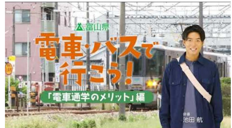
キャンペーンPR動画「電車通学のメリット」編 （再生回数：約2.6万回（11月末現在））