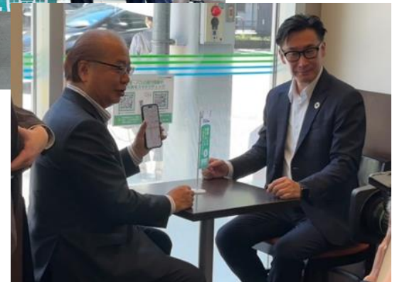
「でんしゃ・バスまち店舗」開設式（7月22日）