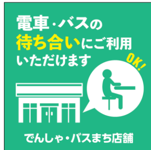
店舗入口ステッカー