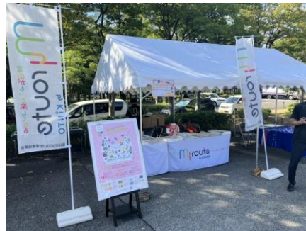
会場でのイベント実施（9月14日）