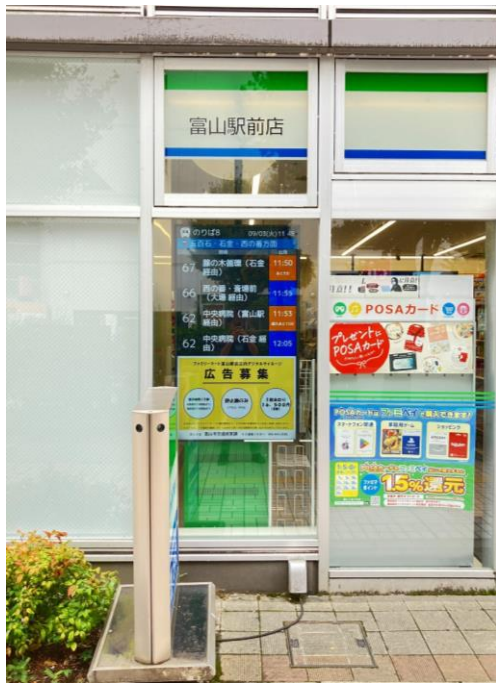
富山駅前8番乗り場前コンビニエンスストア (R6.8月設置)