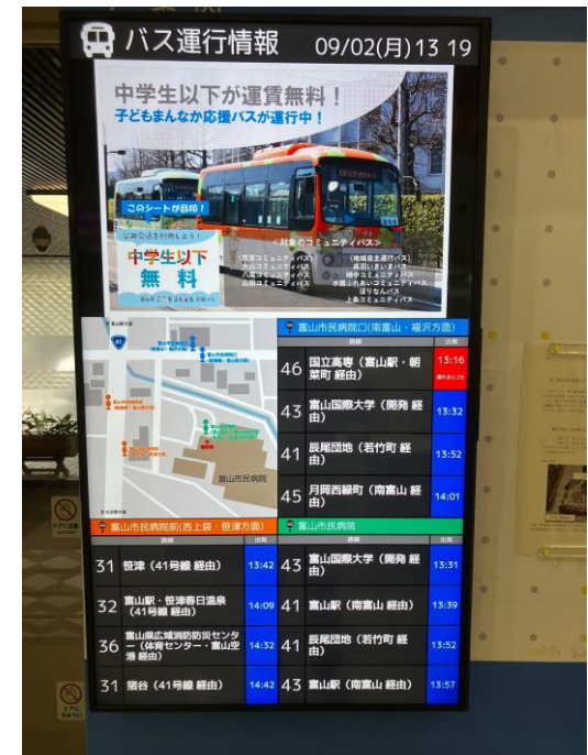
富山市民病院入口のサイネージの例