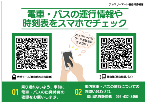
店内ポスターの例（店舗内でリアルタイムの運行情報を案内）