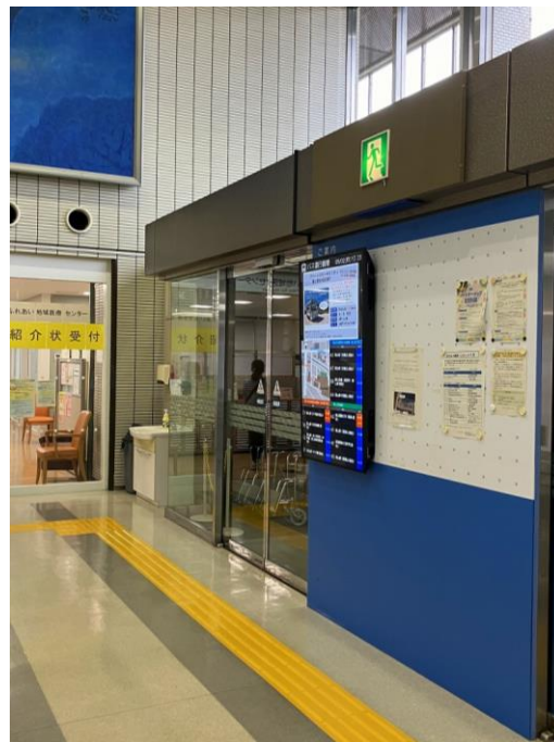
富山市民病院入口 (R6.8月設置)