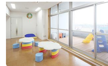
まちなか子育て支援室