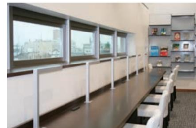
学習・閲覧スペース<図書館>