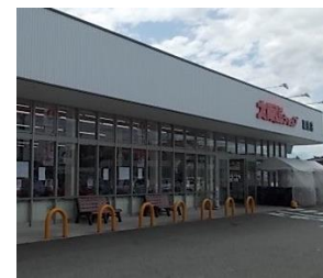
富山地鉄 富山港線 「粟島駅（大阪屋ショップ前）」