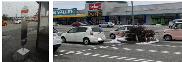
地铁バス笹津線のP&BR駐車場（上二杉バス停）