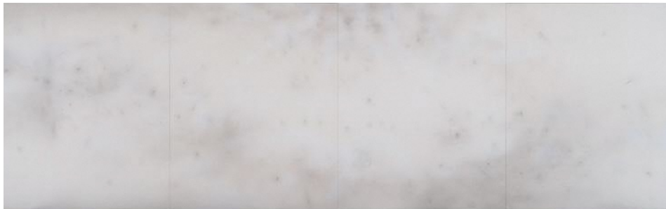
園家誠二《月光》2011年 作家蔵