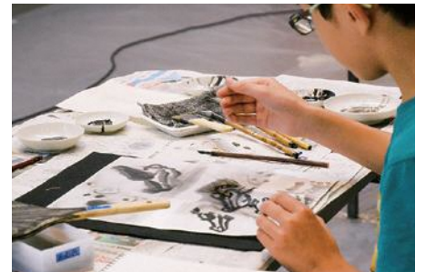
ワークショップの様子(2024年7月30日・31日開催)

当館では、平成14年度から毎年、県内の子どもたちを対象とした水墨画ワークショップを実施し、完成作品等を紹介する展覧会を開催してきました。平成30年度からは、「ひらけ墨画ワールド」と題して、墨画表現に取り組む作家を講師に迎え、講師作品とワークショップ作品に加えて、表現に必要な素材も展示し、多角的に水墨画の世界を紹介しています。