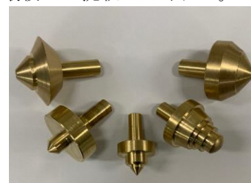
オリジナルコマ作品

今後は、「人間力」というキーワードを大事にしながら実習内容も含めて検討していきたいと改めて実感した。また、他の先生とコミュニケーションも取りながら、同じ目標に向かって取り組んでもらえるよう自身の「人間力」を磨き、生徒の成長につながるしかけづくりに挑戦していきたいと改めて強く思うことができた。