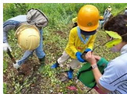
森と地下水の環境観察会

また、地下水保全に関する啓発リーフレットを作成・配布して、県民や事業者に対し、地下水保全や節水についての普及啓発を進めたほか、冬期間の地下水位低下対策のため、市町村と連携してホームページや広報紙で消雪設備等の節水に関する呼びかけを行った。(「とやまの名水」「とやま名水ナビ」「啓発リーフレット」は参考資料に掲載)