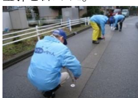
地下水の守り人の活動状況 (消雪設備の点検)

令和5年度は、オンラインとの併催により守り人講習会(計103名参加)を開催し、富山の水循環を考えるとともに、地中熱の利活用による地域の脱炭素に向けた取組みについて理解を深めた。