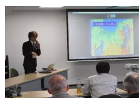
守り人講習会の開催状況