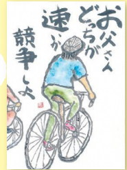
13歳(富山県下新川郡入善町)