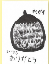
11歳(富山県中新川郡立山町)