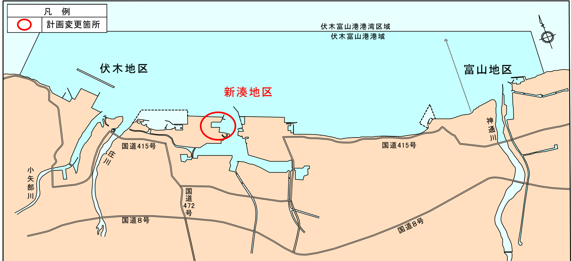
伏木富山港港湾計画位置図