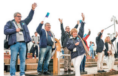
大きく手を振る参加者