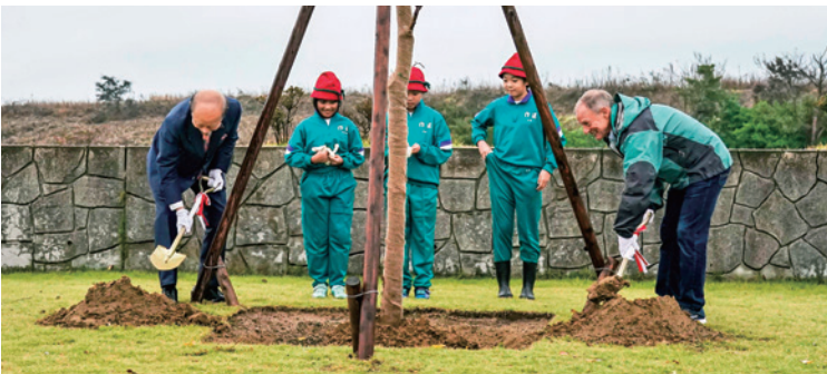
オオシマザクラの植樹