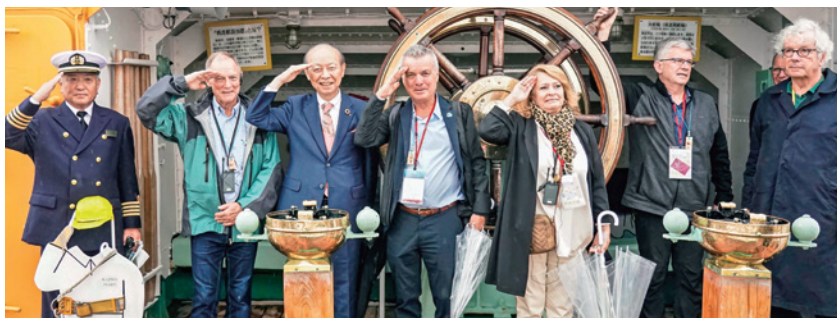
帆船海王丸の舵輪前にて