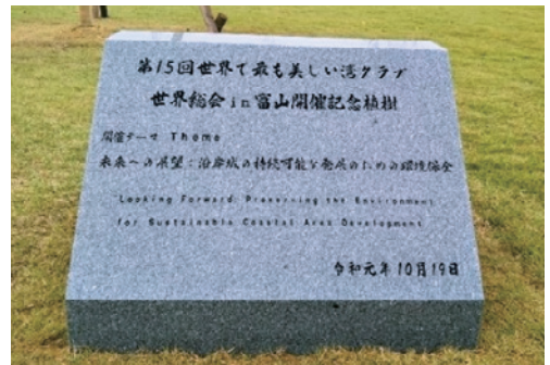
世界総会開催記念碑