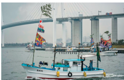
大漁旗を掲げてパレードする漁船

新湊漁業協同組合所属の15隻の漁船が大漁旗を掲げ、富山商業高校吹奏楽部の録音演奏のもと、海王丸パーク内の海上をパレードしました。