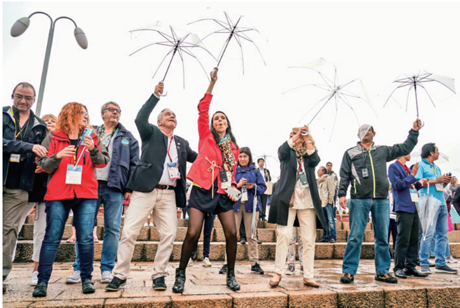
漁船パレードに傘を振って応える参加者