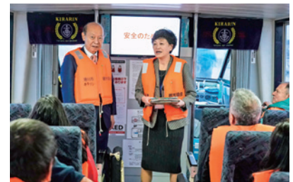
船内で参加者に説明する石井知事