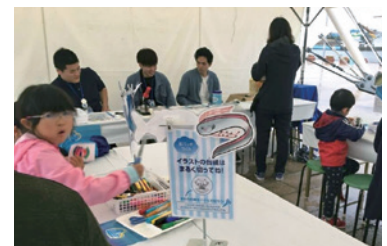
親子ワークショップ