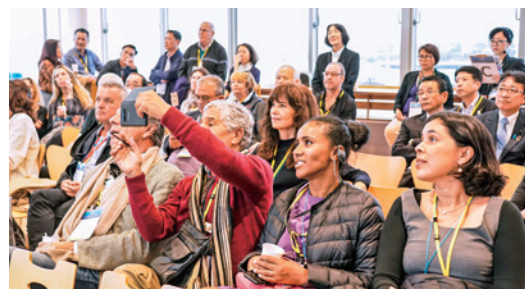
デジタルコンテンツを鑑賞する参加者