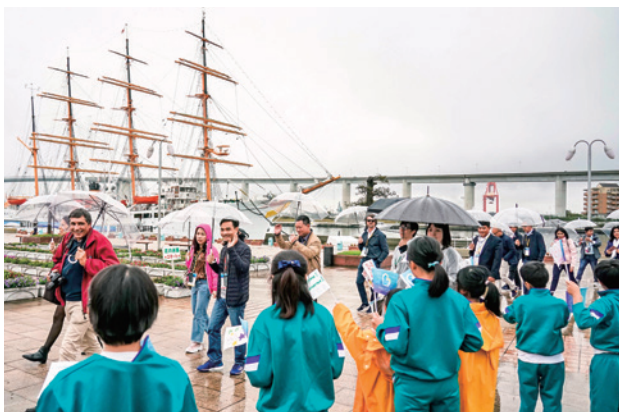
射水市立作道小学校の児童が手持ち旗を振って歓迎