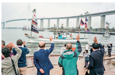
漁船パレードを見学