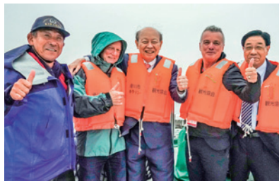
「キラリン」の船上にて

滑川観光遊覧船「キラリン」、氷見遊覧船「若潮」、新湊観光船「万葉丸」に分乗し、海王丸パークから新湊マリーナまでのクルージングを楽しみました。