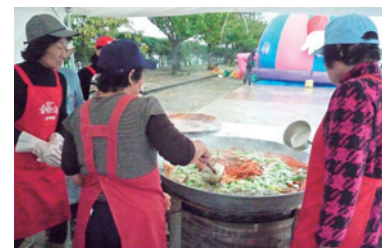
カニ鍋のふるまい