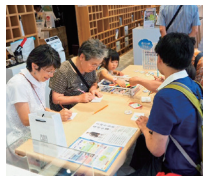
オリジナル缶バッジづくり