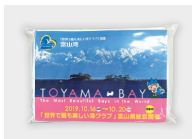
ポケットティッシュ