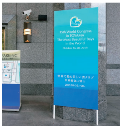
歓迎看板(ホテル正面玄関)