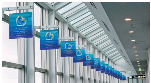
富山きとくと空港