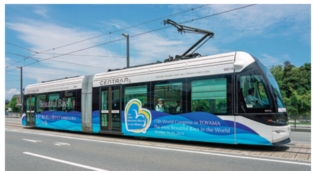
セントラム(白車両) 7月8日～8月7日

富山市内電車環状線(セントラム)と高岡・射水市内の万葉線(アイトラム)の車両を、富山湾の波と立山の山並みを表現したグラデーションでラッピングしました。