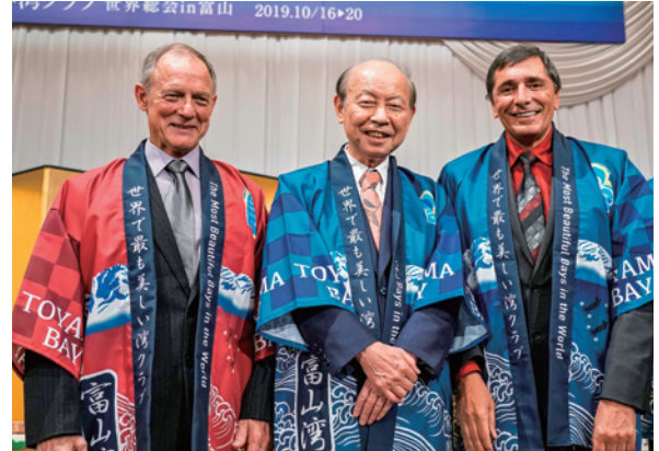
歓迎晩餐会にて法被を着用