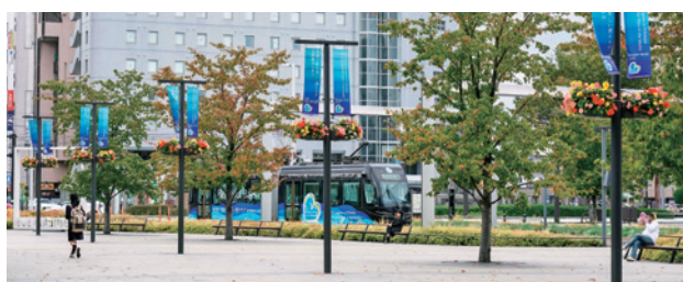
富山駅前南口広場