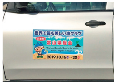
共用車用マグネットシート