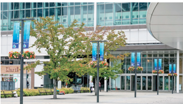
富山駅南口駅前広場