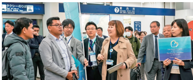
到着出口での出迎え