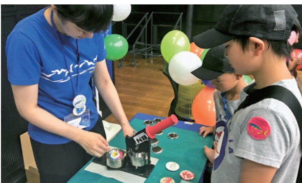
オリジナル缶バッチづくり