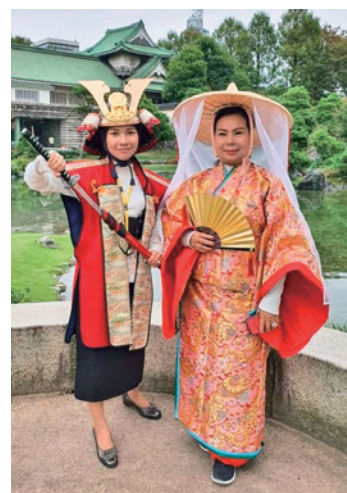
陣羽織と着物の着用体験