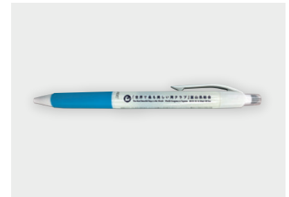
筆記用具(フリクションボールペン)