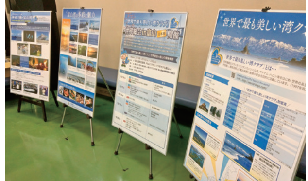
富山湾や世界で最も美しい湾クラブに関するパネルの展示