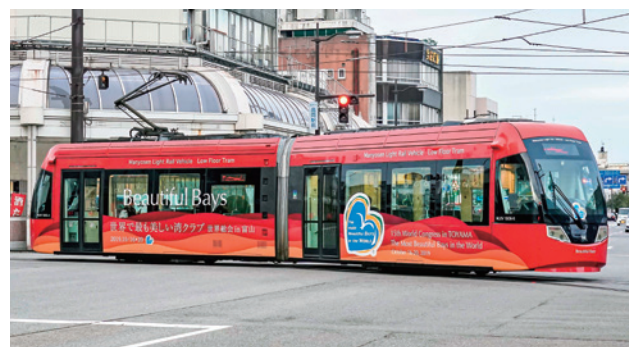
アイトラム 9月24日～10月20日