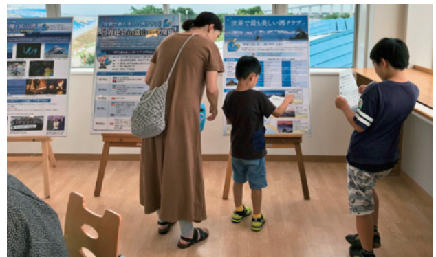
世界で最も美しい湾クラブクイズの実施