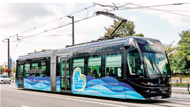
セントラム(黒車両) 9月24日～10月20日