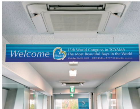
搭乗橋吊り看板(富山きとときと空港)