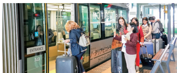
セントラムの乗車方法を説明