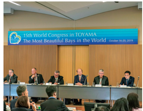
ステージハンガー