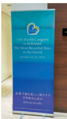
ロールアップバナー