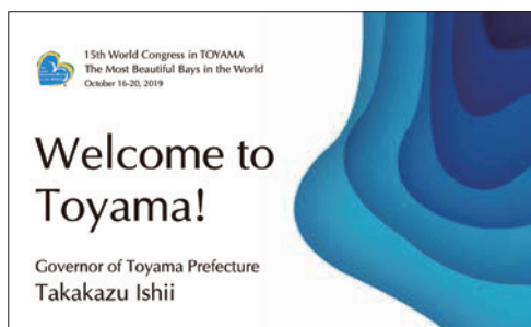
ウェルカムカードとスイーツ