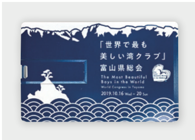
USBメモリ(富山湾PR動画保存)