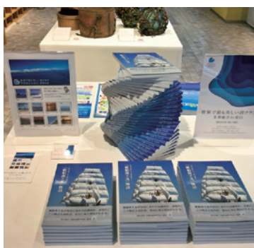
オリジナルフレーム切手の販売