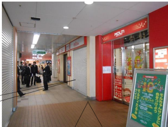
プリコとモルティの境界部