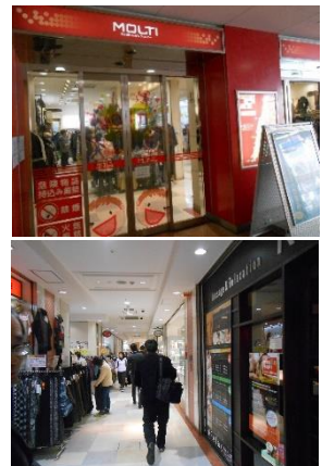
モルティ垂水（山陽電鉄）