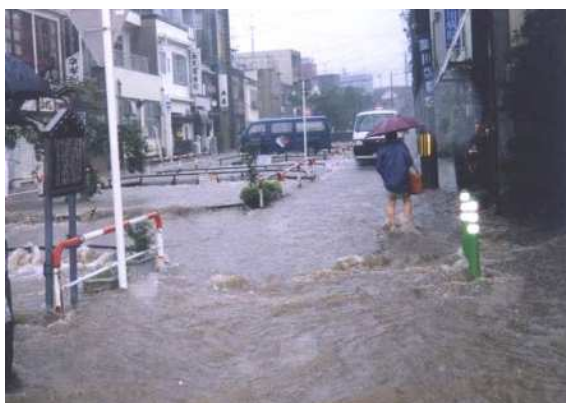
平成 10 年 7 月 鴨川