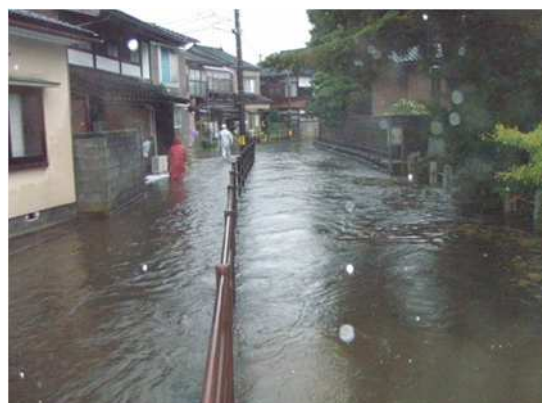
平成 24 年 9 月 沖田川