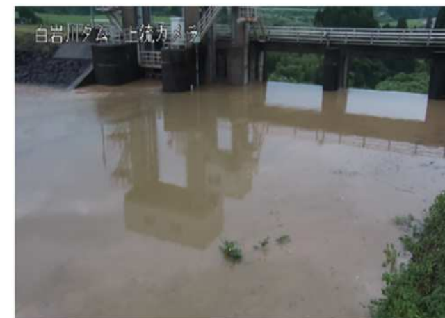
令和5年6月豪雨時の白岩川ダムの状況