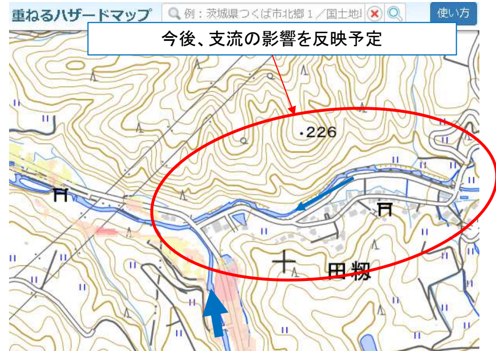
片貝川支流の河川(例：田糲川)