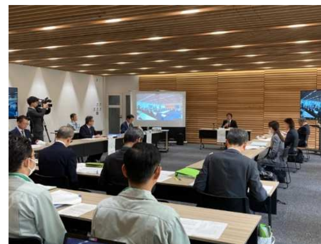
「ダム等に関する情報提供のあり方検討会」の様子