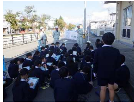
上図 左：資料を用いて説明する様子（氷見市立比美乃江小学校）、中央左：現場で説明する様子（氷見市立比美乃江小学校） 中央右：現場で説明する様子（富山大学附属小学校）、右：質疑応答（富山大学附属小学校）