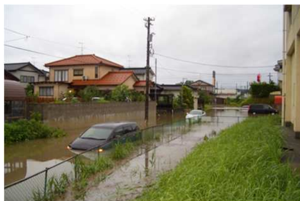
平成 17 年 7 月 上庄川