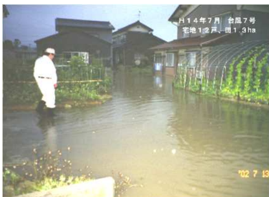
平成 14 年 7 月 仏生寺川