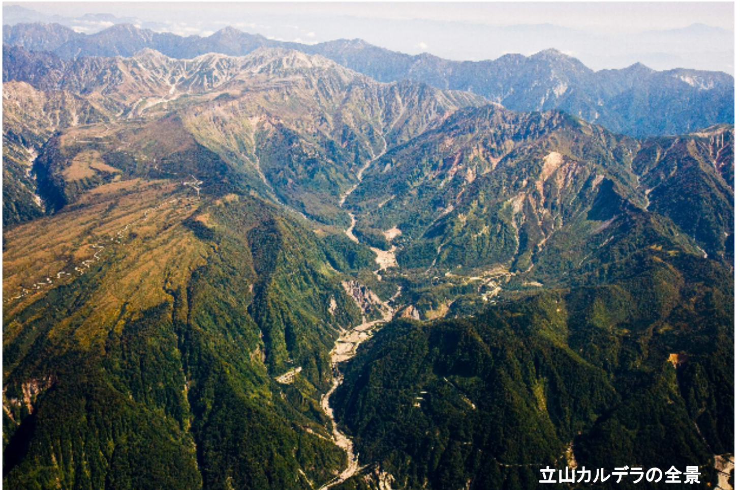
立山カルデラの全景