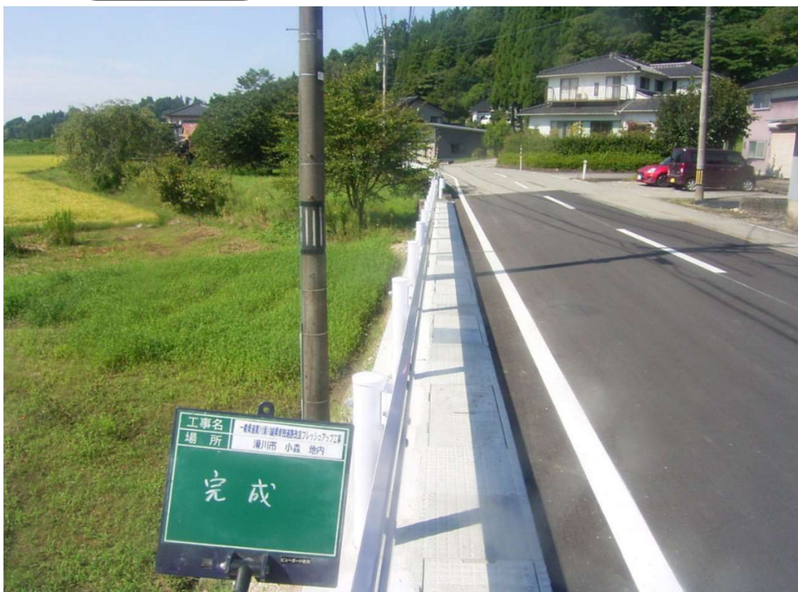
一般県道黒川滑川線県単独道路改良フレッシュアップ工事