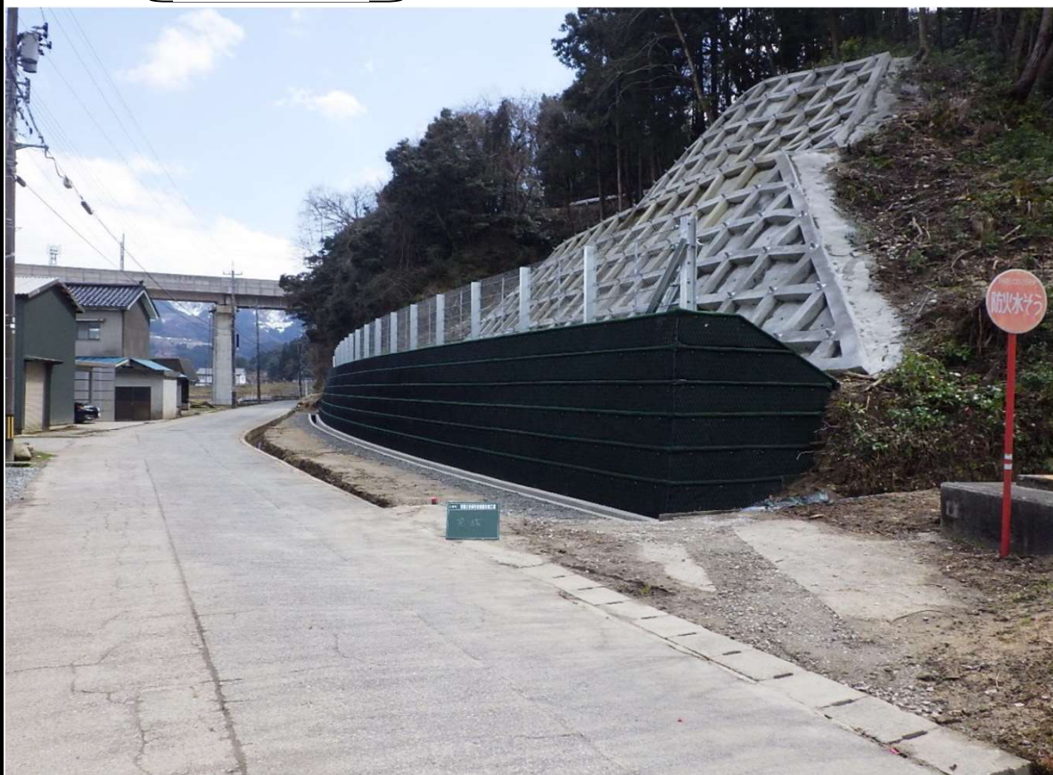
市道出金山谷線道路改良工事