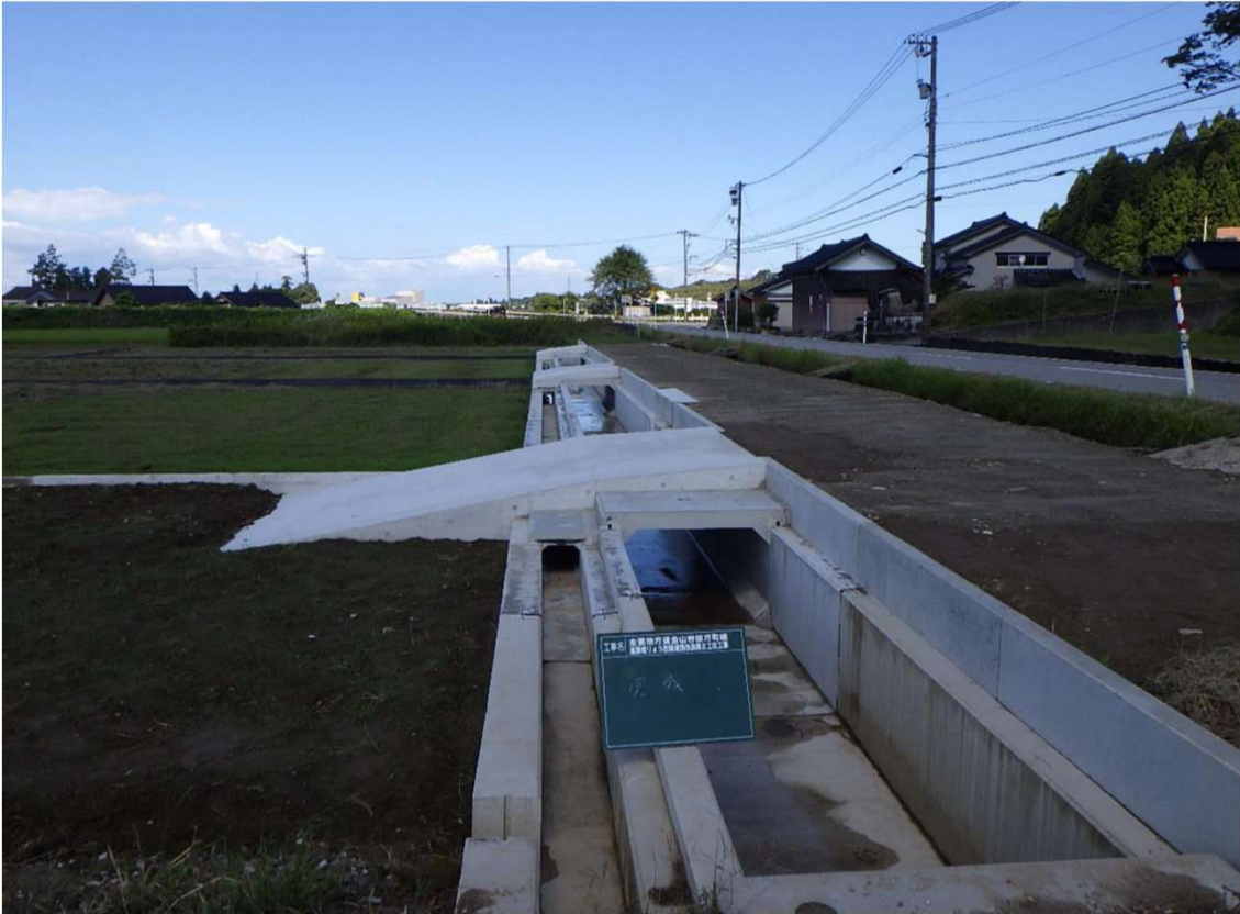
主要地方道金山谷田方町線道路橋りょう改築道路改良第2工区工事