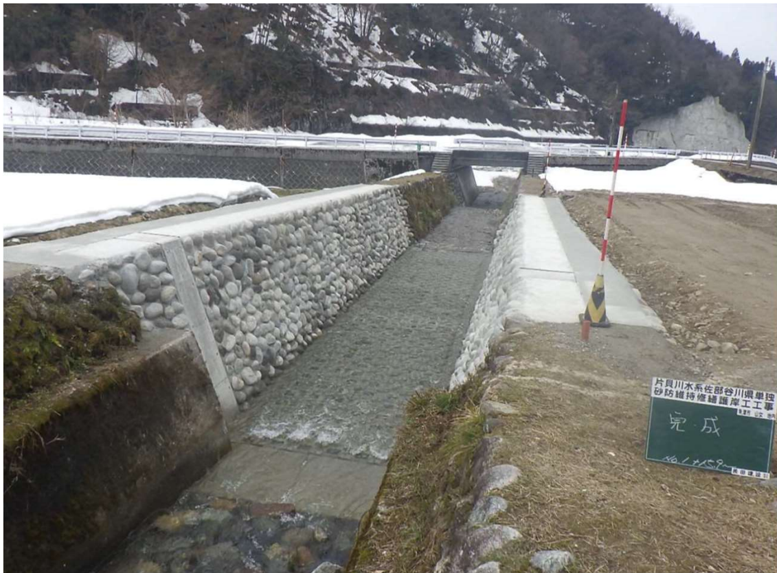
片貝川水系佐部谷川県単独砂防維持修繕護岸工工事