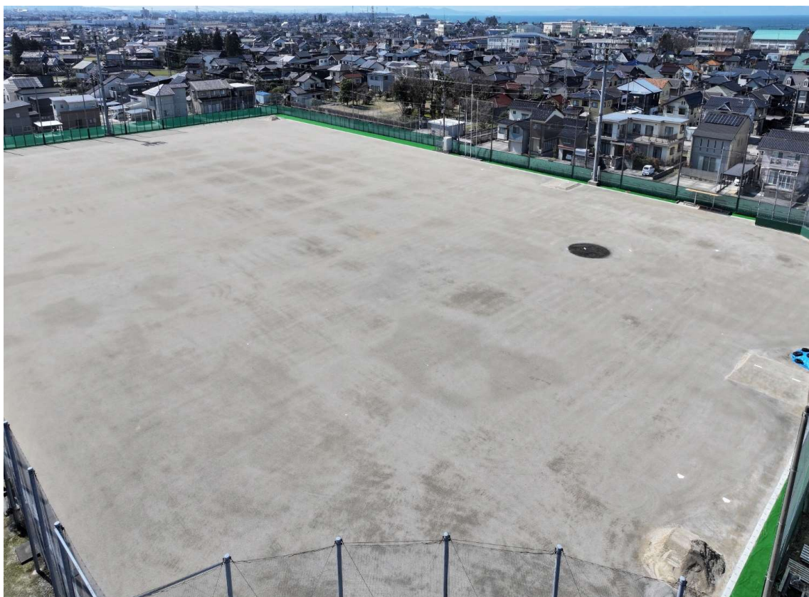
滑川中学校グラウンド改修工事