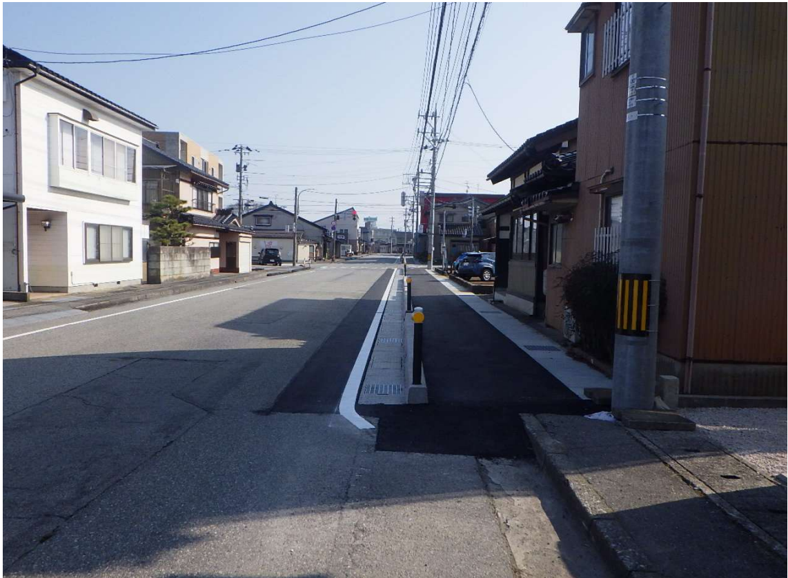
市道菰原辰野線道路改良工事