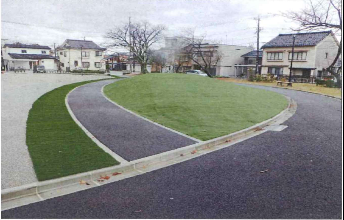
新金屋公園改修工事