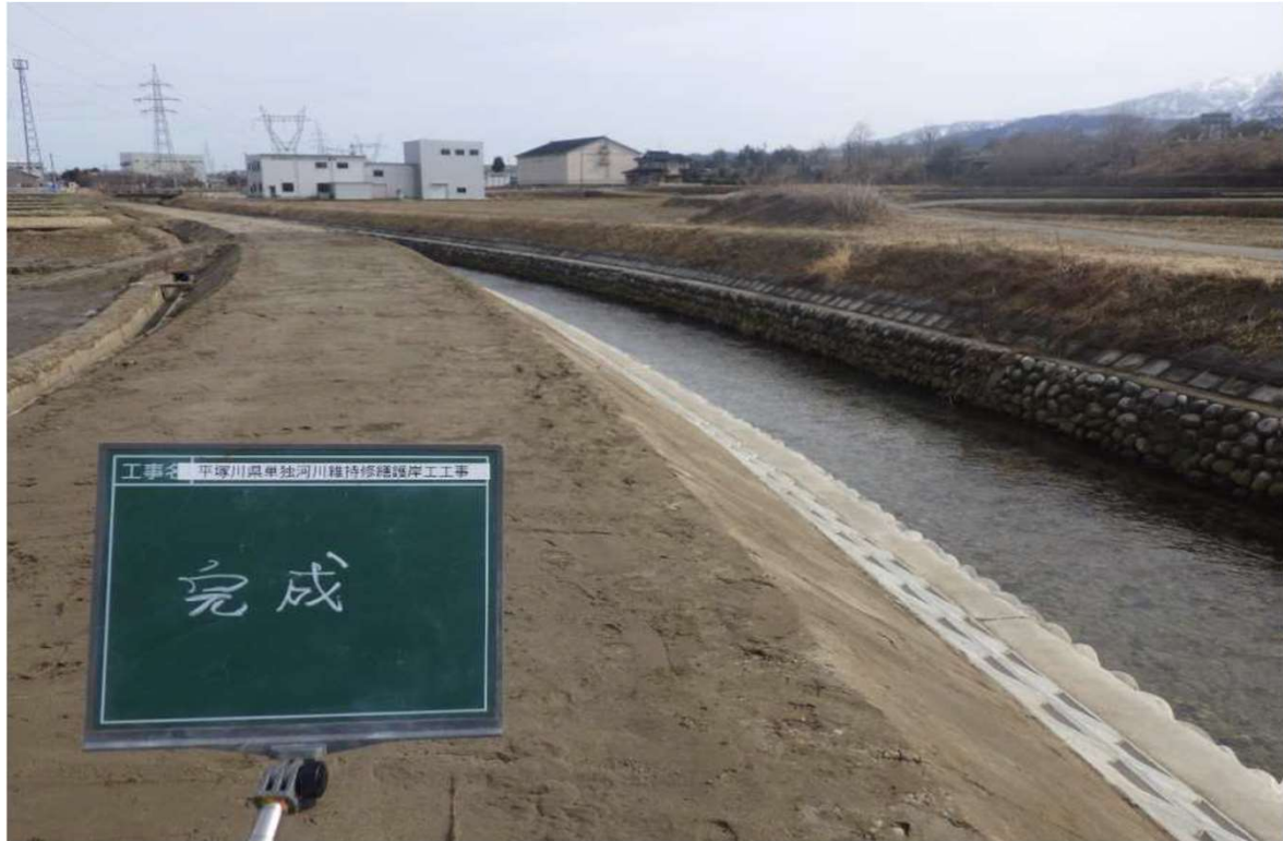
平塚川県単独河川維持修繕護岸工工事